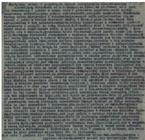
„Raport nr 3 z terenu WW 72 - 53 KK. Stan do połowy października 1943 r.”, przedstawiający przyczyny i rozmiary „wsyp” w wileńskiej