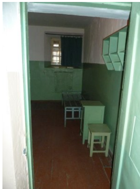
Cela aresztu śledczego przy ul. Ofiarnej w Wilnie. Z relacji por. Bolesława Nowika: „Monter” dostał tapczan tapicerski do celi i trzymany był dla pozorów. To wywołało podejrzenia”