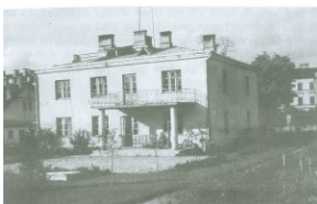
Siedziba Abwehry w Wilnie przy ul. Zakretowej 16. Budynek zachował się do dnia dzisiejszego (zbiory Hinricha-Boy Christiansena)