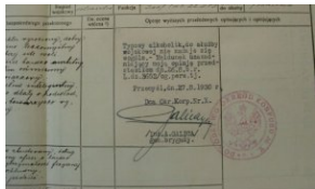
Opinia wystawiona jeszcze w sierpniu 1930 r. rtm. Wacławowi Giećewiczowi przez dowódcę Okręgu Korpusu nr X w Przemyślu gen. Andrzeja Galicę