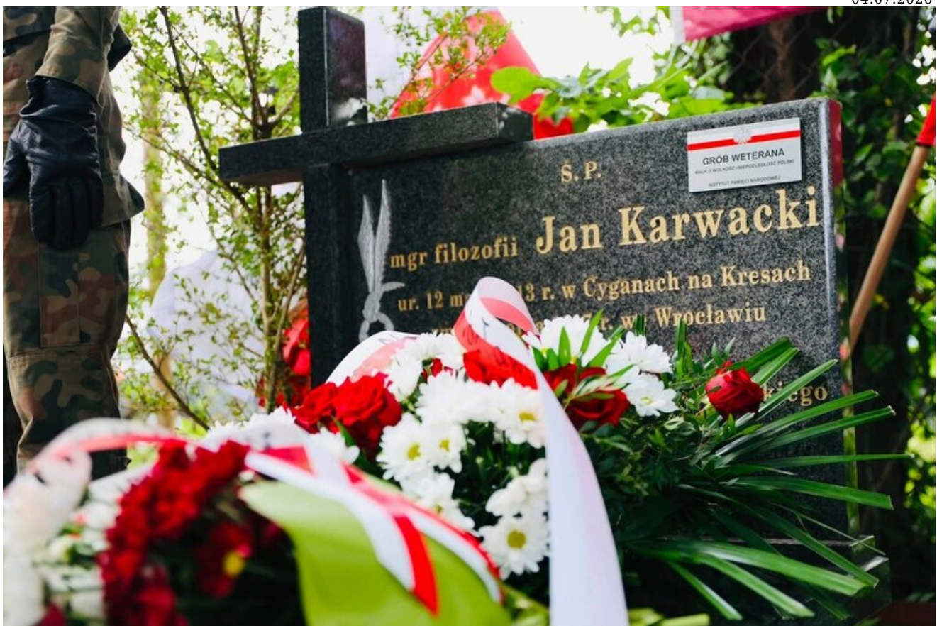
Za nami uroczystość upamiętniająca kpt. Jana Karwackiego – oficera Wojska Polskiego, żołnierza Korpusu Ochrony Pogranicza oraz 1 Samodzielnej Brygady Spadochronowej, uczestnika operacji „Market Garden” - Wrocław, 4 lipca 2026