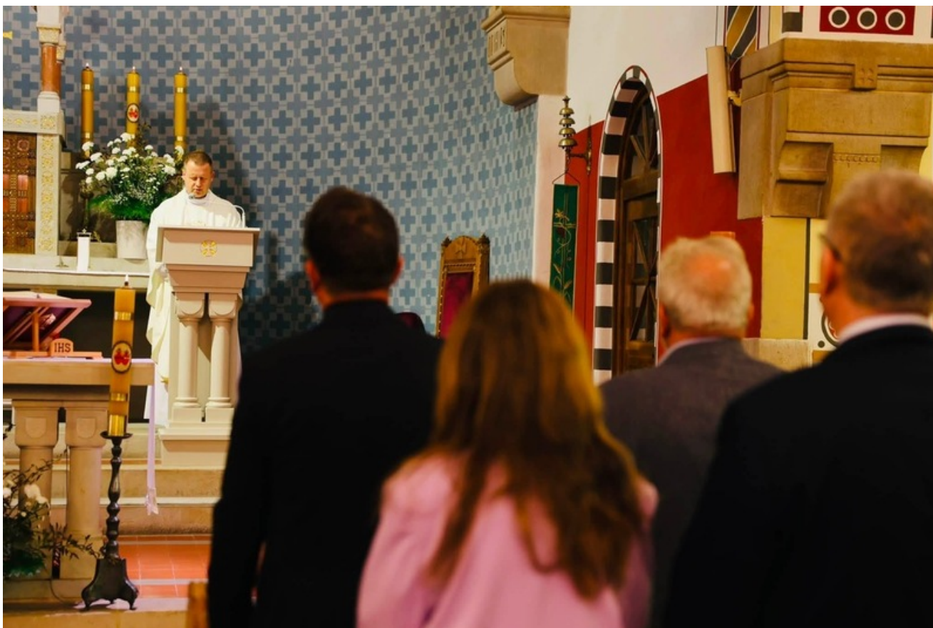
Za nami uroczystość upamiętniająca kpt. Jana Karwackiego - oficera Wojska Polskiego, żołnierza Korpusu Ochrony Pogranicza oraz 1 Samodzielnej Brygady Spadochronowej, uczestnika operacji „Market Garden” - Wrocław, 4 lipca 2026

Na cmentarzu parafialnym Wrocław-Księża Małe odbyła się uroczystość upamiętniająca kpt. Jana Karwackiego - oficera Wojska Polskiego, żołnierza Korpusu Ochrony Pogranicza oraz 1 Samodzielnej Brygady Spadochronowej, uczestnika operacji „Market Garden”. Wydarzenie zostało zorganizowane przez Oddział Instytutu Pamięi Narodowej we Wrocławiu z okazji uhonorowania miejsca jego spoczynku insygnium Grobu Weterana Walk o Wolność i Niepodległość Polski.