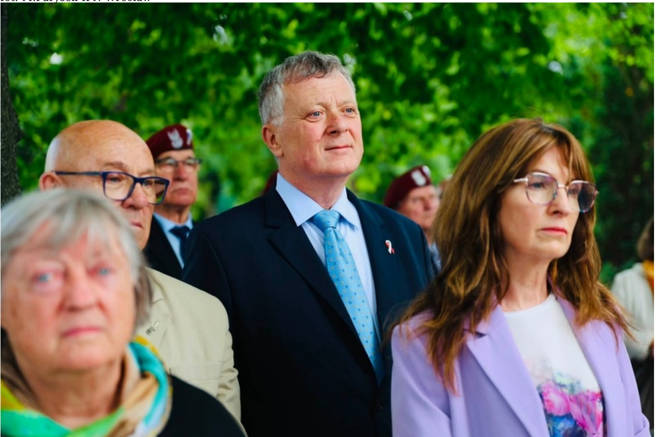
Za nami uroczystość upamiętniająca kpt. Jana Karwackiego - oficera Wojska Polskiego, żołnierza Korpusu Ochrony Pogranicza oraz 1 Samodzielnej Brygady Spadochronowej, uczestnika operacji „Market Garden” - Wrocław, 4 lipca 2026