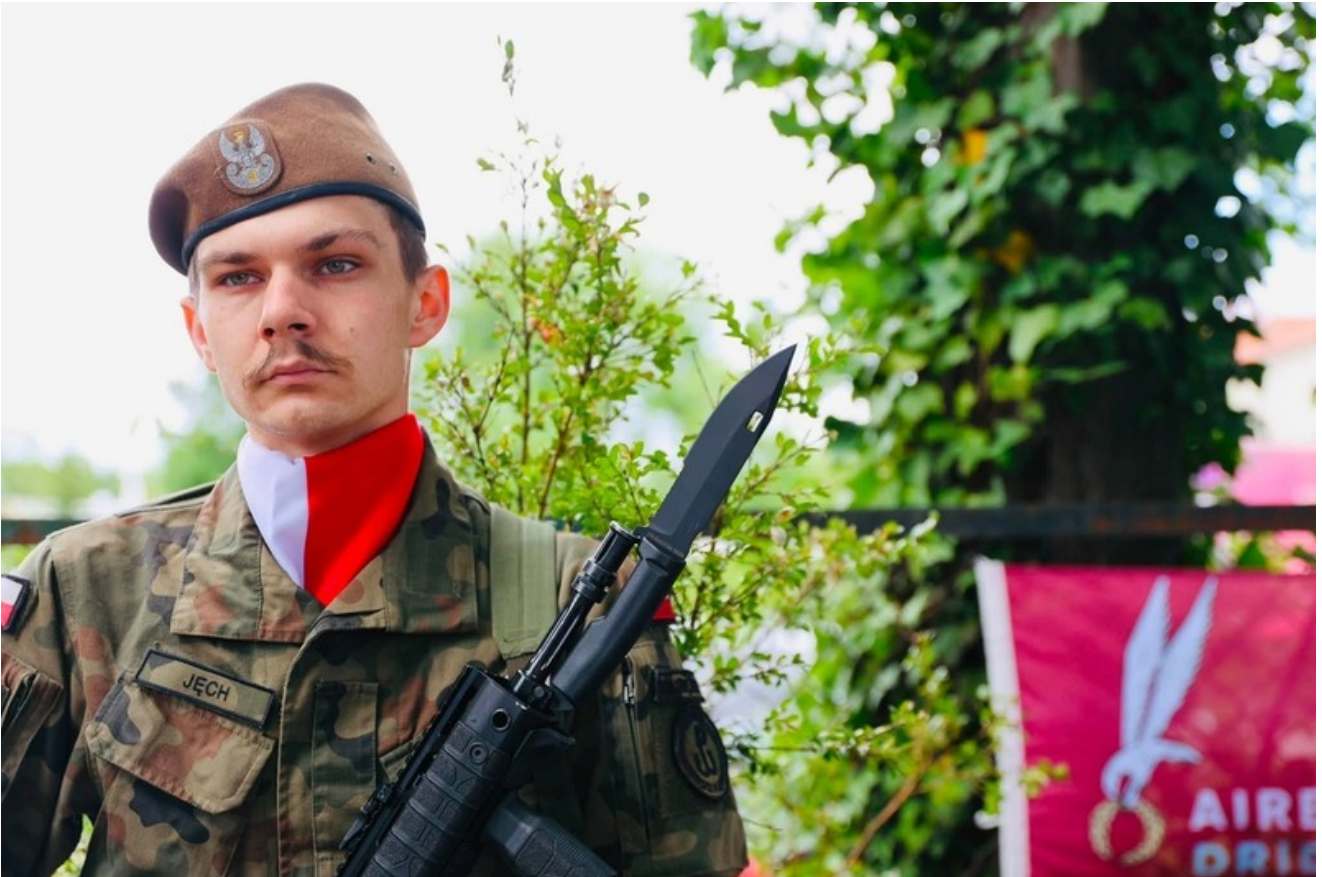
Za nami uroczystość upamiętniająca kpt. Jana Karwackiego - oficera Wojska Polskiego, żołnierza Korpusu Ochrony Pogranicza oraz 1 Samodzielnej Brygady Spadochronowej, uczestnika operacji „Market Garden” - Wrocław, 4 lipca 2026