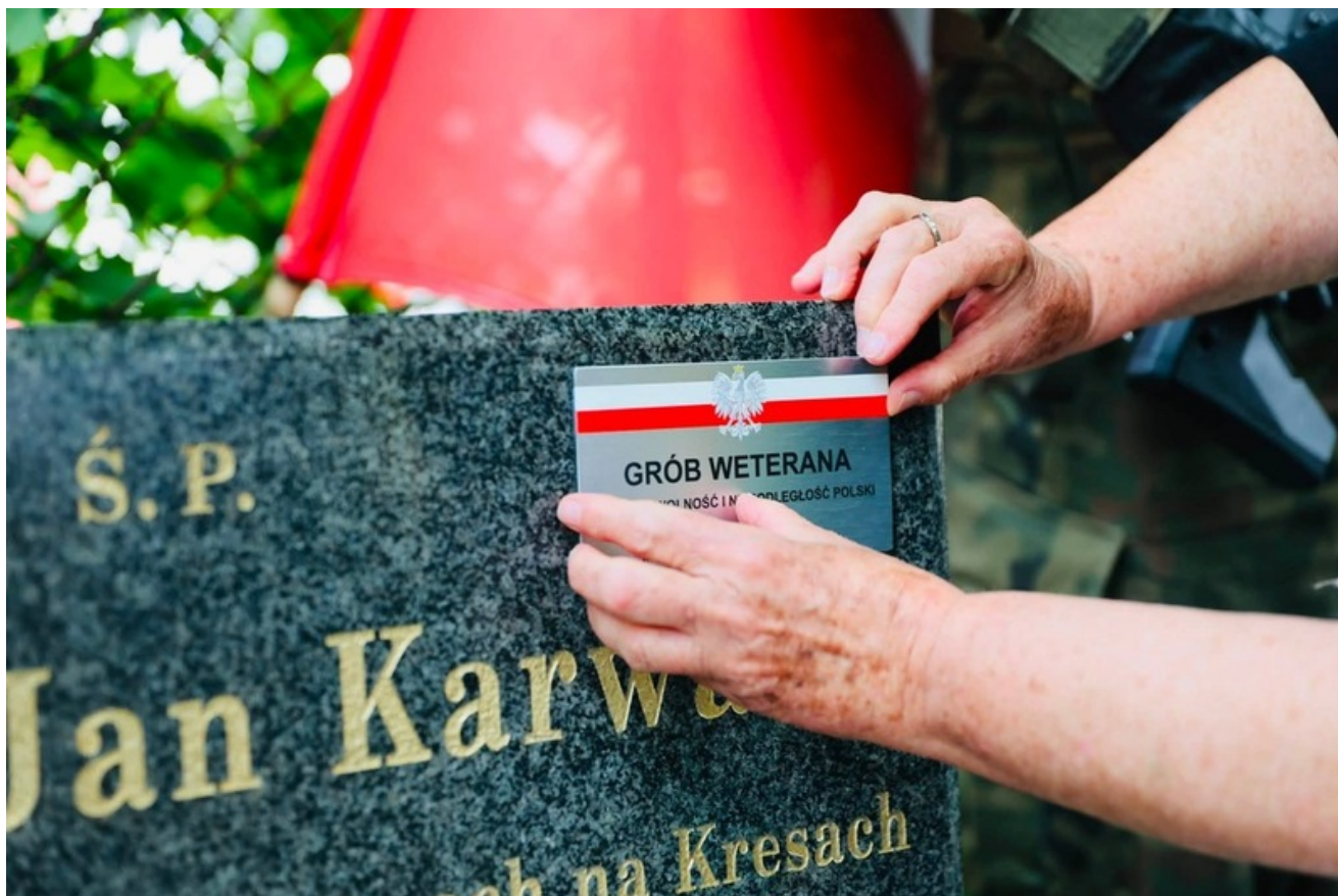
Za nami uroczystość upamiętniająca kpt. Jana Karwackiego – oficera Wojska Polskiego, żołnierza Korpusu Ochrony Pogranicza oraz 1 Samodzielnej Brygady Spadochronowej, uczestnika operacji „Market Garden” - Wrocław, 4 lipca 2026