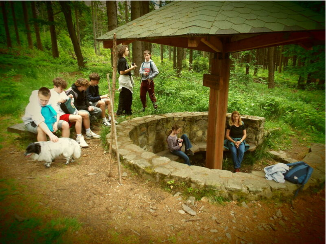
Od Kostiuchnowki do Borówkowej - historia, którą trzeba przejść Finał warsztatów historycznych uczniów SP 96 pokazał, że prawdziwe zrozumienie przeszłości rodzi się nie tylko z lektury źródeł, lecz także z doświadczenia, samodzielności i działania w terenie - Wrocław, 17 czerwca 2026