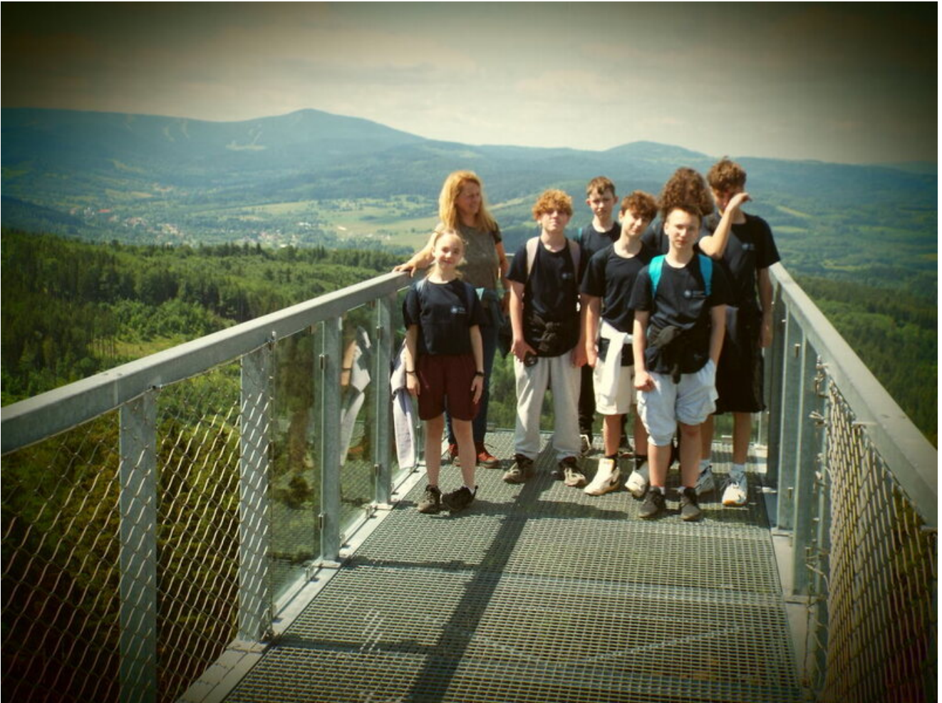
Od Kostiuchnowki do Borówkowej - historia, którą trzeba przejść Finał warsztatów historycznych uczniów SP 96 pokazał, że prawdziwe zrozumienie przeszłości rodzi się nie tylko z lektury źródeł, lecz także z doświadczenia, samodzielności i działania w terenie - Wrocław, 17 czerwca 2026