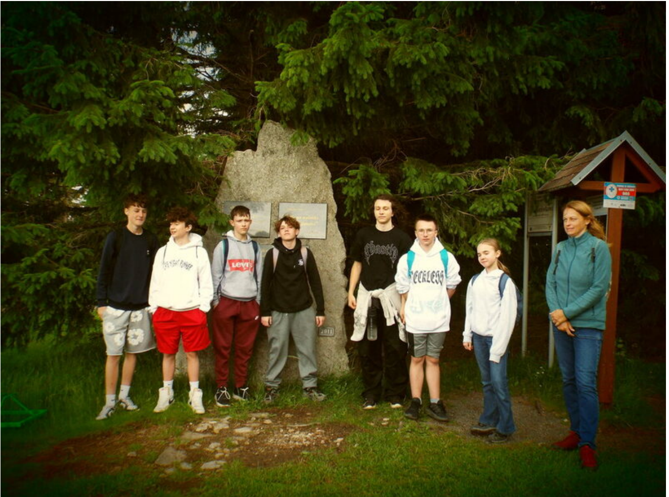
Od Kostiuchnowki do Borówkowej - historia, którą trzeba przejść Finał warsztatów historycznych uczniów SP 96 pokazał, że prawdziwe zrozumienie przeszłości rodzi się nie tylko z lektury źródeł, lecz także z doświadczenia, samodzielności i działania w terenie - Wrocław, 17 czerwca 2026