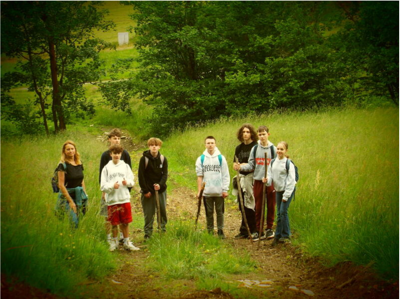
Od Kostiuchnowki do Borówkowej - historia, którą trzeba przejść Finał warsztatów historycznych uczniów SP 96 pokazał, że prawdziwe zrozumienie przeszłości rodzi się nie tylko z lektury źródeł, lecz także z doświadczenia, samodzielności i działania w terenie - Wrocław, 17 czerwca 2026