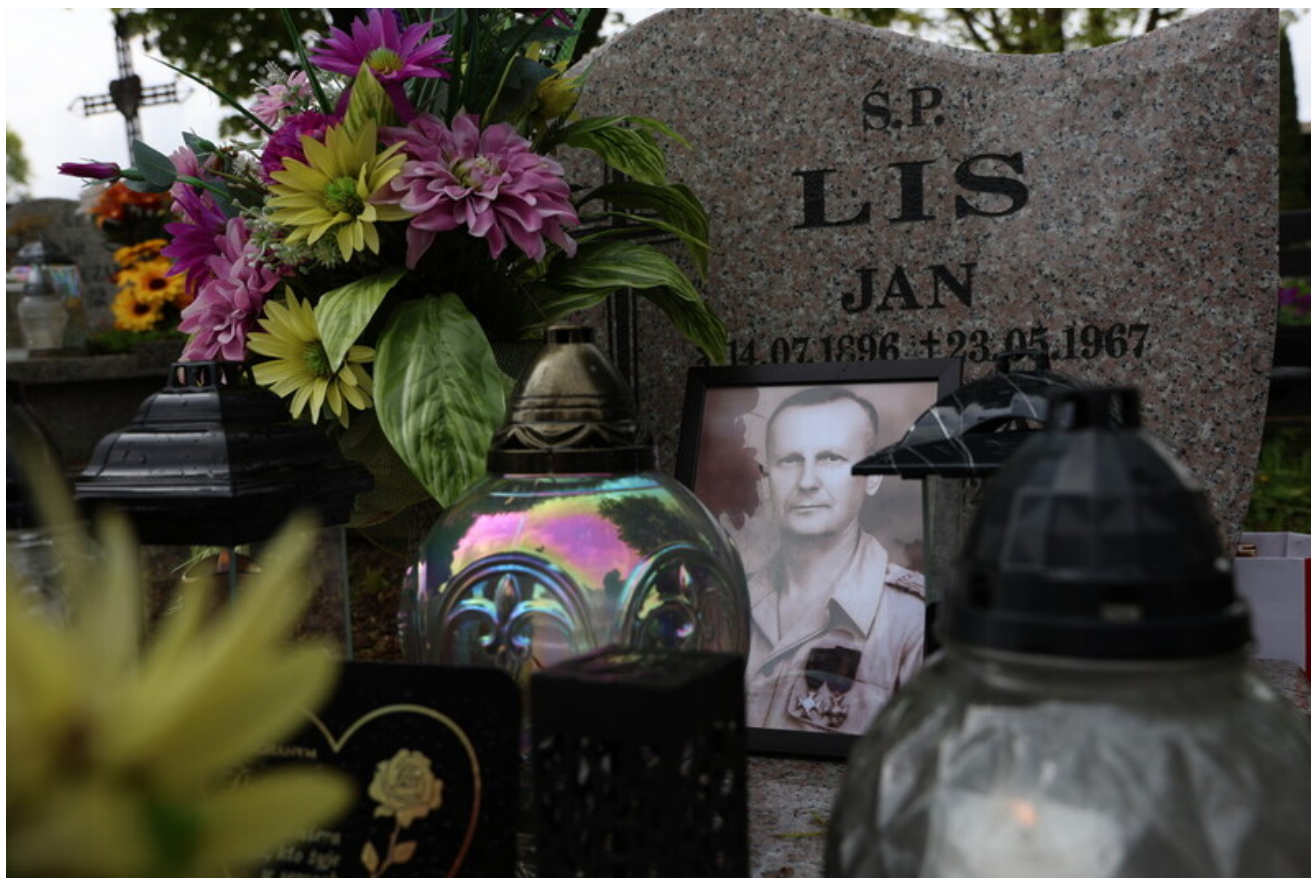
Uroczystość odsłonięcia i poświęcenia grobu wojennego porucznika Włodzimierza Porowskiego — żołnierza Wojska Polskiego i członka Polskiej Organizacji Wojskowej - Kamienna Góra, 15 maja 2026