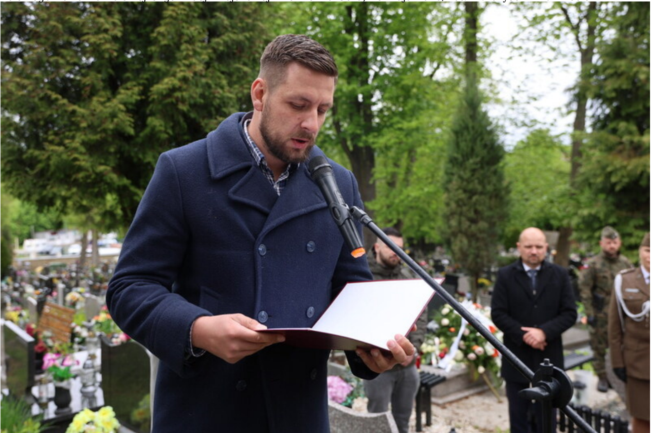
Uroczystość odsłonięcia i poświęcenia grobu wojennego porucznika Włodzimierza Porowskiego — żołnierza Wojska Polskiego i członka Polskiej Organizacji Wojskowej - Kamienna Góra, 15 maja 2026