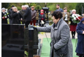
Pamięci Polaków, Ormian i Sprawiedliwych Ukraińców z Kut nad Czeremoszem pomordowanych przez ukraińskich nacionalistów w 1944 roku - Oborniki Śląskie, 22 kwietnia 2024/ fot.