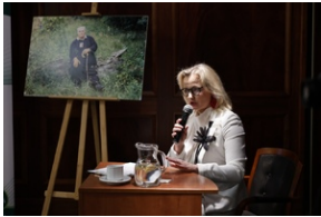
Seminarium historyczne „Wczoraj i dziś Duszpasterstwa Akademickiego »Wawrzyny«” - Wrocław, 18-21 kwietnia 2024