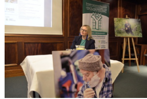
Seminarium historyczne „Wczoraj i dziś Duszpasterstwa Akademickiego »Wawrzyny«” - Wrocław, 18-21 kwietnia 2024