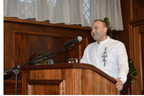
Seminarium historyczne „Wczoraj i dziś Duszpasterstwa Akademickiego »Wawrzyny«” - Wrocław, 18-21 kwietnia 2024