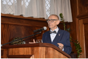
Seminarium historyczne „Wczoraj i dziś Duszpasterstwa Akademickiego »Wawrzyny«” - Wrocław, 18-21 kwietnia 2024