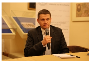
Prezentacja książki „Do domu, ku wolności. Rola Czechosłowacji w migracji ludności polskiej w latach