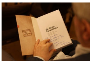
Prezentacja książki „Do domu, ku wolności. Rola Czechosłowacji w migracji ludności polskiej w latach