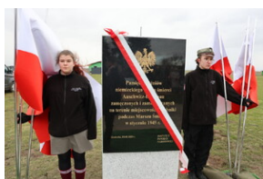
Odsłonięto tablicę upamiętniającą więźniów niemieckiego obozu koncentracyjnego Auschwitz-Birkenau - Grobniki, 27 stycznia 2023