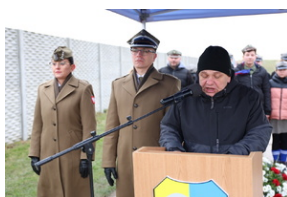
Odsłonięto tablicę upamiętniającą więźniów niemieckiego obozu koncentracyjnego Auschwitz-Birkenau - Grobniki, 27 stycznia 2023