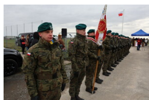
Odsłonięto tablicę upamiętniającą więźniów niemieckiego obozu koncentracyjnego Auschwitz-Birkenau - Grobniki, 27 stycznia 2023

W ostatnich miesiącach II wojny światowej przez Grobniki przebiegał jeden ze szlaków „ewakuacji” obozu Auschwitz-Birkenau w głąb Niemiec.