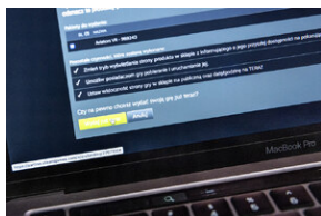
Światowa premiera edukacyjnego projektu gamingowego IPN „Lotnicy” w Londynie – 24 stycznia 2024.