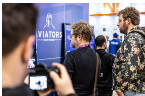
Światowa premiera edukacyjnego projektu gamingowego IPN „Lotnicy” w Londynie – 24 stycznia 2024.