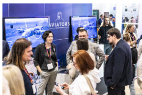
Światowa premiera edukacyjnego projektu gamingowego IPN „Lotnicy” w Londynie – 24 stycznia 2024.