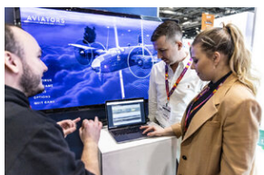
Światowa premiera edukacyjnego projektu gamingowego IPN „Lotnicy” w Londynie – 24 stycznia 2024.