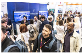
Światowa premiera edukacyjnego projektu gamingowego IPN „Lotnicy” w Londynie – 24 stycznia 2024.