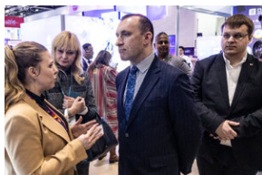
Światowa premiera edukacyjnego projektu gamingowego IPN „Lotnicy” w Londynie – 24 stycznia 2024.