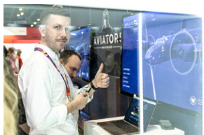
Światowa premiera edukacyjnego projektu gamingowego IPN „Lotnicy” w Londynie – 24 stycznia 2024.