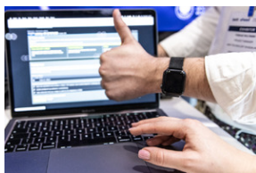
Światowa premiera edukacyjnego projektu gamingowego IPN „Lotnicy” w Londynie – 24 stycznia 2024.