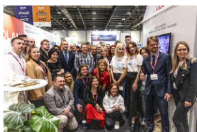
Światowa premiera edukacyjnego projektu gamingowego IPN „Lotnicy” w Londynie – 24 stycznia 2024.