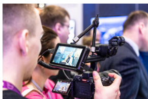
Światowa premiera edukacyjnego projektu gamingowego IPN „Lotnicy” w Londynie – 24 stycznia 2024.