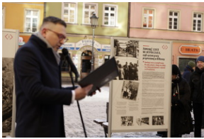
Otwarcie wystawy o niemieckim obozie pracy Burgweide oraz premiera książki - Wrocław, 19 stycznia 2024