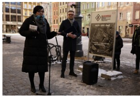
Otwarcie wystawy o niemieckim obozie pracy Burgweide oraz premiera książki - Wrocław, 19 stycznia 2024