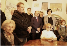
Otwarcie wystawy o niemieckim obozie pracy Burgweide oraz premiery książki - Wrocław, 19 stycznia 2024