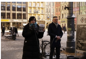
Otwarcie wystawy o niemieckim obozie pracy Burgweide oraz premiera książki - Wrocław, 19 stycznia 2024