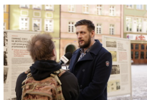
Otwarcie wystawy o niemieckim obozie pracy Burgweide oraz