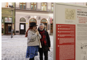
Otwarcie wystawy o niemieckim obozie pracy Burgweide oraz premiery książki -