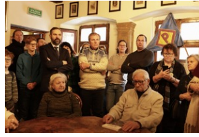
Otwarcie wystawy o niemieckim obozie pracy Burgweide oraz premiery książki - Wrocław, 19 stycznia 2024