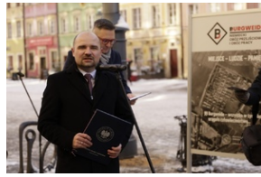
Otwarcie wystawy o niemieckim obozie pracy Burgweide oraz premiera książki - Wrocław, 19 stycznia 2024