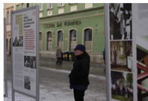
Otwarcie wystawy o niemieckim obozie pracy Burgweide oraz premiera książki - Wrocław, 19 stycznia 2024