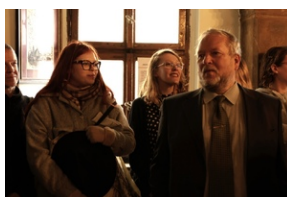
Otwarcie wystawy o niemieckim obozie pracy Burgweide oraz