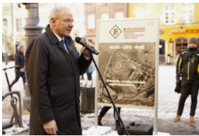
Otwarcie wystawy o niemieckim obozie pracy Burgweide oraz premiera książki - Wrocław, 19 stycznia 2024