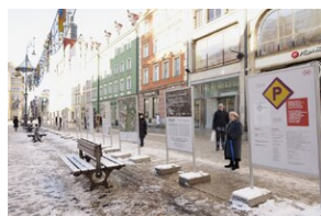
Otwarcie wystawy o niemieckim obozie pracy Burgweide oraz premiery książki -

W kamieniczce Małgosia przy ulicy Odrzańskiej 39/40 (północno-zachodni narożnik Rynku) można obejrzeć m.in. oryginalne dokumenty, rękopisy wspomnień oraz artefakty odnalezione podczas badań archeologicznych przeprowadzonych kilka lat temu na terenie poobozowym. Ekspozycyjna część wystawy będzie dostępna od poniedziałku do piątku w godzinach od 12.00 do 18.00.