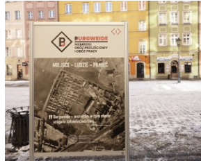
Otwarcie wystawy o niemieckim obozie pracy Burgweide oraz premiera książki - Wrocław, 19 stycznia 2024