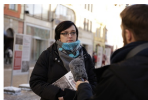
Otwarcie wystawy o niemieckim obozie pracy Burgweide oraz premiery książki -