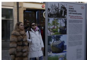
Otwarcie wystawy o niemieckim obozie pracy Burgweide oraz premiera książki - Wrocław, 19 stycznia 2024