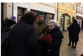
Otwarcie wystawy o niemieckim obozie pracy Burgweide oraz