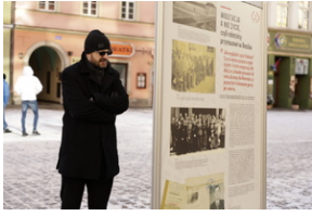
Otwarcie wystawy o niemieckim obozie pracy Burgweide oraz premiera książki - Wrocław, 19 stycznia 2024