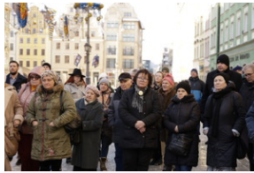
Otwarcie wystawy o niemieckim obozie pracy Burgweide oraz premiera książki - Wrocław, 19 stycznia 2024