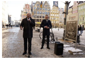
Otwarcie wystawy o niemieckim obozie pracy Burgweide oraz premiera książki - Wrocław, 19 stycznia 2024