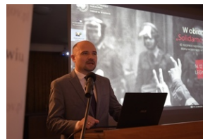
Konferencja popularno-naukowa „W obronie Solidarności” w 42. rocznicę wprowadzenia stanu wojennego w Polsce – Legnica, 14 grudnia 2023