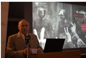
Konferencja popularno-naukowa „W obronie Solidarności” w 42. rocznicę wprowadzenia stanu wojennego w Polsce – Legnica, 14 grudnia 2023