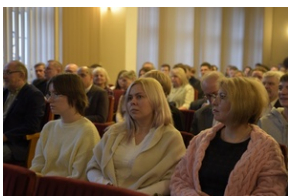
Konferencja popularno-naukowa „W obronie Solidarności” w 42. rocznicę wprowadzenia stanu wojennego w Polsce – Legnica, 14 grudnia 2023