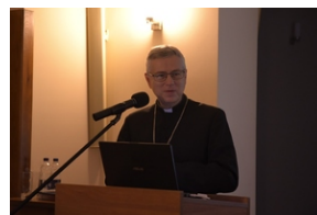
Konferencja popularno-naukowa „W obronie Solidarności” w 42. rocznicę wprowadzenia stanu wojennego w Polsce – Legnica, 14 grudnia 2023