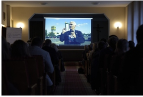
Konferencja popularno-naukowa „W obronie Solidarności” w 42. rocznicę wprowadzenia stanu wojennego w Polsce – Legnica, 14 grudnia 2023