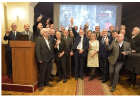
Konferencja popularno-naukowa „W obronie Solidarności” w 42. rocznicę wprowadzenia stanu wojennego w Polsce – Legnica, 14 grudnia 2023