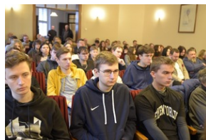
Konferencja popularno-naukowa „W obronie Solidarności” w 42. rocznicę wprowadzenia stanu wojennego w Polsce – Legnica, 14 grudnia 2023