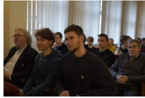
Konferencja popularno-naukowa „W obronie Solidarności” w 42. rocznicę wprowadzenia stanu wojennego w Polsce – Legnica, 14 grudnia 2023