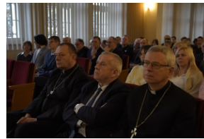
Konferencja popularno-naukowa „W obronie Solidarności” w 42. rocznicę wprowadzenia stanu wojennego w Polsce – Legnica, 14 grudnia 2023