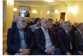
Konferencja popularno-naukowa „W obronie Solidarności” w 42. rocznicę wprowadzenia stanu wojennego w Polsce – Legnica, 14 grudnia 2023