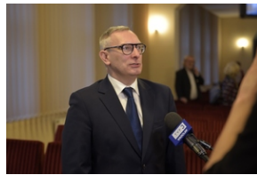
Konferencja popularno-naukowa „W obronie Solidarności” w 42. rocznicę wprowadzenia stanu wojennego w Polsce – Legnica, 14 grudnia 2023