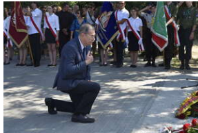
Odśonięcie pomnika na terenie byłego niemieckiego obozu Burgweide - Wrocław, 11 września 2023 roku