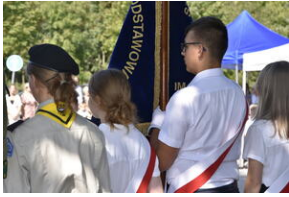
11 września 2023 roku