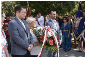
Odśonięcie pomnika na terenie byłego niemieckiego obozu Burgweide - Wrocław, 11 września 2023 roku