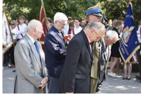
Odśonięcie pomnika na terenie byłego niemieckiego obozu Burgweide - Wrocław, 11 września 2023 roku