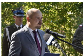
Odsłonięcie pomnika na terenie byłego niemieckiego obozu Burgweide - Wrocław,