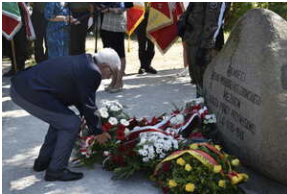
Odśonięcie pomnika na terenie byłego niemieckiego obozu Burgweide - Wrocław, 11 września 2023 roku