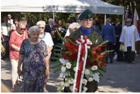
Odśonięcie pomnika na terenie byłego niemieckiego obozu Burgweide - Wrocław, 11 września 2023 roku