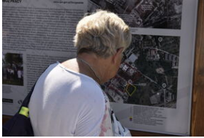
Odsłonięcie pomnika na terenie byłego niemieckiego obozu Burgweide - Wrocław, 11 września 2023 roku