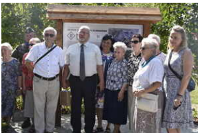
Odśonięcie pomnika na terenie byłego niemieckiego obozu Burgweide - Wrocław, 11 września 2023 roku