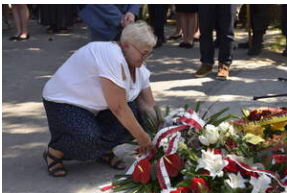
Odśonięcie pomnika na terenie byłego niemieckiego obozu Burgweide - Wrocław, 11 września 2023 roku