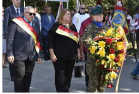
Odśonięcie pomnika na terenie byłego niemieckiego obozu Burgweide - Wrocław, 11 września 2023 roku/ fot. M.Parysek IPN Wrocław