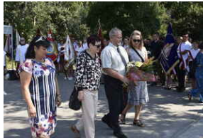
Odśonięcie pomnika na terenie byłego niemieckiego obozu Burgweide - Wrocław, 11 września 2023 roku