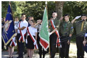
Odśonięcie pomnika na terenie byłego niemieckiego obozu Burgweide - Wrocław, 11 września 2023 roku/ fot. M.Parysek IPN Wrocław