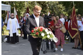
Odśonięcie pomnika na terenie byłego niemieckiego obozu Burgweide - Wrocław, 11 września 2023 roku