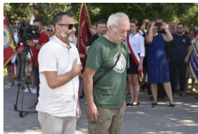
Odśonięcie pomnika na terenie byłego niemieckiego obozu Burgweide - Wrocław, 11 września 2023 roku