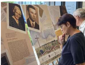
Mija 80 lat od tzw. „Krwawej Niedzieli”, „Jak rozmawiać o Wołyńiu 80 lat później?” - Wrocław, 10 lipca 2023