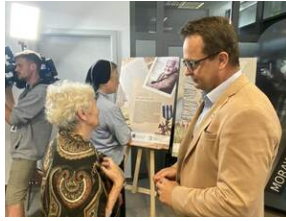
Mija 80 lat od tzw. „Krwawej Niedzieli”, „Jak rozmawiać o Wołyńiu 80 lat później?” - Wrocław, 10 lipca 2023