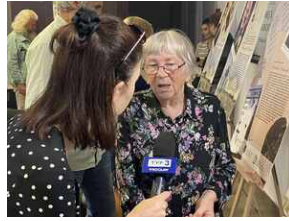
Mija 80 lat od tzw. „Krwawej Niedzieli”, „Jak rozmawiać o Wołyńiu 80 lat później?” - Wrocław, 10 lipca 2023