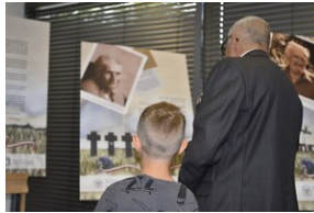
Mija 80 lat od tzw. „Krwawej Niedzieli”, „Jak rozmawiać o Wołyńiu 80 lat później?” - Wrocław, 10 lipca 2023