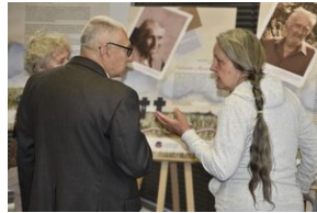
Mija 80 lat od tzw. „Krwawej Niedzieli”, „Jak rozmawiać o Wołyńiu 80 lat później?” - Wrocław, 10 lipca 2023