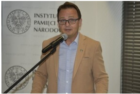
Mija 80 lat od tzw. „Krwawej Niedzieli”, „Jak rozmawiać o Wołyńiu 80 lat później?” - Wrocław, 10 lipca 2023