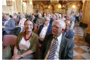
Jubileusz Klubu Dyskusyjnego „Spotkanie i Dialog” - Wrocław, 7 czerwca 2023