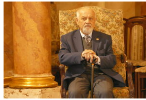
Jubileusz Klubu Dyskusyjnego „Spotkanie i Dialog” - Wrocław, 7 czerwca 2023