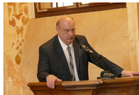
Jubileusz Klubu Dyskusyjnego „Spotkanie i Dialog” - Wrocław, 7 czerwca 2023