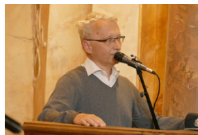
Jubileusz Klubu Dyskusyjnego „Spotkanie i Dialog” - Wrocław, 7 czerwca 2023