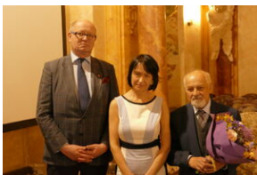
Jubileusz Klubu Dyskusyjnego „Spotkanie i Dialog” - Wrocław, 7 czerwca 2023