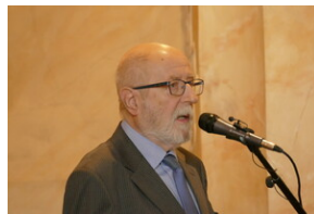
Jubileusz Klubu Dyskusyjnego „Spotkanie i Dialog” - Wrocław, 7 czerwca 2023