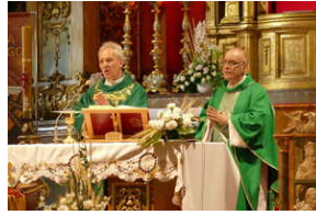
Jubileusz Klubu Dyskusyjnego „Spotkanie i Dialog” - Wrocław, 7 czerwca 2023