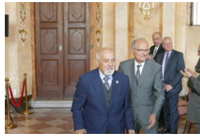
Jubileusz Klubu Dyskusyjnego „Spotkanie i Dialog” - Wrocław, 7 czerwca 2023