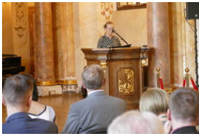
Jubileusz Klubu Dyskusyjnego „Spotkanie i Dialog” - Wrocław, 7 czerwca 2023