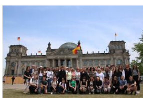
Finaliści IX Ogólnopolskiego Konkursu