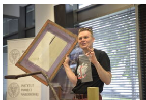
Warsztaty drukarskie dla młodzieży - okres opozycji antykomunistycznej - Przystanek Historia IPN Im. Kornela Morawieckiego - Wrocław, 15 maja 2023