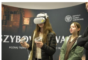
Wrocław, 15 maja 2023