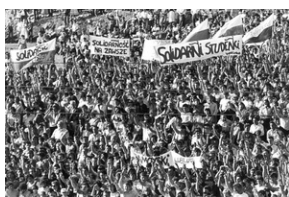
2 kwietnia 2005 roku po ponad 26 - letnim pontyfikacie do wieczności odszedł Jan Paweł II (Karol Wojtyła)