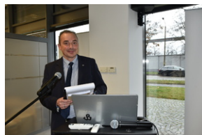
O historycznych i współczesnych relacjach między koleją a przemysłem, Wrocław - 7 grudnia 2022