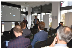
O historycznych i współczesnych relacjach między koleją a przemysłem, Wrocław - 7 grudnia 2022