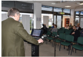
O historycznych i współczesnych relacjach między koleją a przemysłem, Wrocław - 7 grudnia 2022