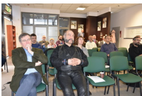
O historycznych i współczesnych relacjach między koleją a przemysłem, Wrocław - 7 grudnia 2022