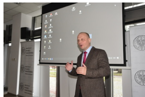
O historycznych i współczesnych relacjach między koleją a przemysłem, Wrocław - 7 grudnia 2022