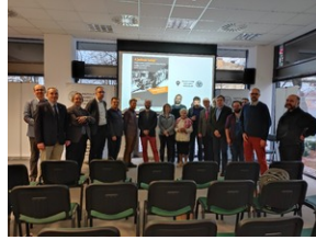
O historycznych i współczesnych relacjach między koleją a przemysłem, Wrocław - 7 grudnia 2022