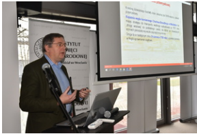
O historycznych i współczesnych relacjach między koleją a przemysłem, Wrocław - 7 grudnia 2022