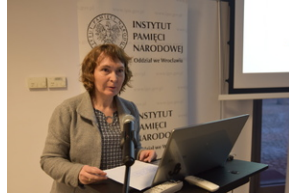
O historycznych i współczesnych relacjach między koleją a przemysłem, Wrocław - 7 grudnia 2022