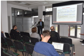
O historycznych i współczesnych relacjach między koleją a przemysłem, Wrocław - 7 grudnia 2022