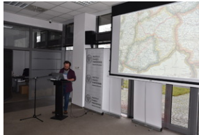
O historycznych i współczesnych relacjach między koleją a przemysłem, Wrocław - 7 grudnia 2022