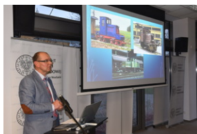
O historycznych i współczesnych relacjach między koleją a przemysłem, Wrocław - 7 grudnia 2022