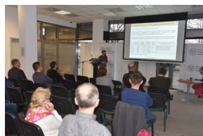
O historycznych i współczesnych relacjach między koleją a przemysłem, Wrocław - 7 grudnia 2022