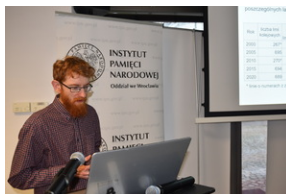
O historycznych i współczesnych relacjach między koleją a przemysłem, Wrocław - 7 grudnia 2022