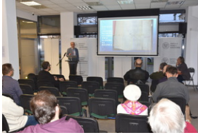
O historycznych i współczesnych relacjach między koleją a przemysłem, Wrocław - 7 grudnia 2022