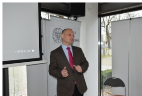
O historycznych i współczesnych relacjach między koleją a przemysłem, Wrocław - 7 grudnia 2022