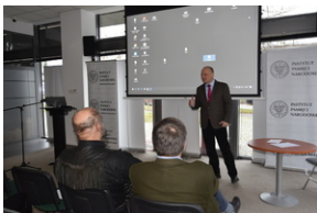
O historycznych i współczesnych relacjach między koleją a przemysłem, Wrocław - 7 grudnia 2022