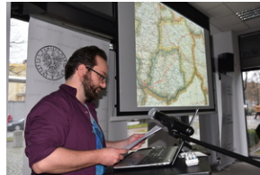
O historycznych i współczesnych relacjach między koleją a przemysłem, Wrocław - 7 grudnia 2022