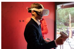
Każdy z nas może złamać bolszewickie szyfry i zniszczyć sowiecki pociąg pancerny