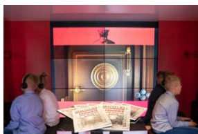
Rozwiązania zastosowane w grze powstały na bazie materiałów źródłowych lub zostały dokładnie odwzorowane z historycznych eksponatów