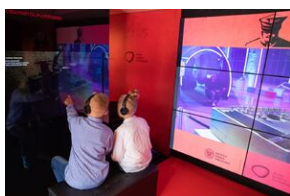
Gra udostępniona zostanie bezpłatnie na platformie Steam. Można ją będzie również pobrać z AppStore oraz Sklepu Play