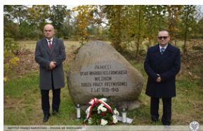
Upamiętnić ofiary Arbeitslager Burgweide - Wrocław, 5 października 2022.