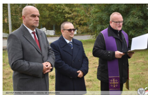
Upamiętnić ofiary Arbeitslager Burgweide - Wrocław, 5 października 2022.