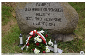
Upamiętnić ofiary Arbeitslager Burgweide - Wrocław, 5 października 2022.