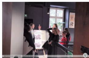
Poetycki portret bohatera - Wrocław, 28 września 2022