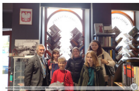
Poetycki portret bohatera - Wrocław, 28 września 2022