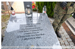
Projekt „Ocalamy” – Oława, 27 września 2022