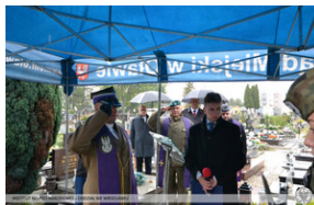
Projekt „Ocalamy” – Oława, 27 września 2022