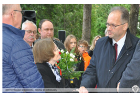
80. rocznica powstania Narodowych Sił Zbrojnych. Projekt Ocalamy – uhonorowanie grobu