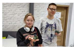
Warsztaty „Modele powstałe z historii” - 22 września 2022 r.