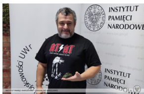
Warsztaty „Modele powstare z historii” – 22 września 2022 r.; fot. P. Ruciński.