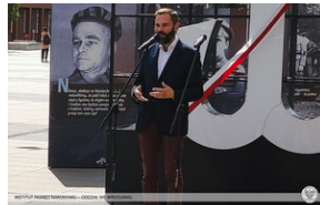
Otwarcie wernisażu wystawy plenerowej Instytutu Pamięci Narodowej „Armia Krajowa” – Wrocław, 1 września 2022.