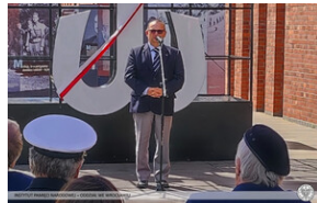
Otwarcie wernisażu wystawy plenerowej Instytutu Pamięci Narodowej „Armia Krajowa” – Wrocław, 1 września 2022.