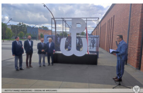
Otwarcie wernisażu wystawy plenerowej Instytutu Pamięci Narodowej „Armia Krajowa” – Wrocław, 1 września 2022.