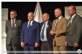
Odznaczeni Krzyżem Wolności i Solidarności wraz z prezesem IPN – Polkowice, 29 sierpnia 2022.