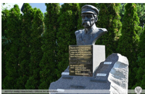
Złożenie wiązanek i zapalenie zniczy Ocalamy Pamięć – Wrocław, 15 sierpnia 2022