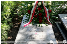
Złożenie wiązanek i zapalenie zniczy Ocalamy Pamięć – Wrocław, 15 sierpnia 2022