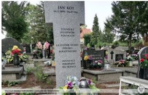
Złożenie wiązanek i zapalenie zniczy Ocalamy Pamięć – Wrocław, 15 sierpnia 2022