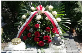
Złożenie wiązanek i zapalenie zniczy Ocalamy Pamięć – Wrocław, 15 sierpnia 2022