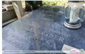
Złożenie wiązanek i zapalenie zniczy Ocalamy Pamięć – Wrocław, 15 sierpnia 2022