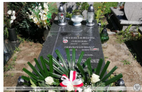
Złożenie wiązanek i zapalenie zniczy Ocalamy Pamięć – Wrocław, 15 sierpnia 2022