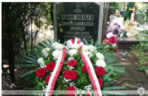
Złożenie wiązanek i zapalenie zniczy Ocalamy Pamięć – Wrocław, 15 sierpnia 2022