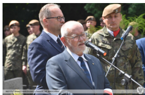
Uroczyste upamiętnienie ppłk. Ludwika Marszałka ps. „Zoroja” w 110. rocznicę urodzin -