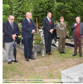
Poświęcenie nowego nagrobka żołnierza z Monte Cassino