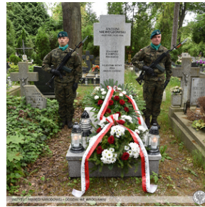
Poświęcenie nowego nagrobka żołnierza z Monte Cassino