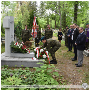
Poświęcenie nowego nagrobka żołnierza z Monte Cassino