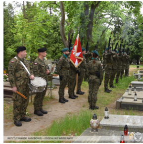
Poświęcenie nowego nagrobka żołnierza z Monte Cassino