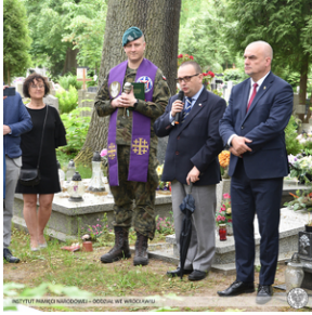
Poświęcenie nowego nagrobka żołnierza z Monte Cassino