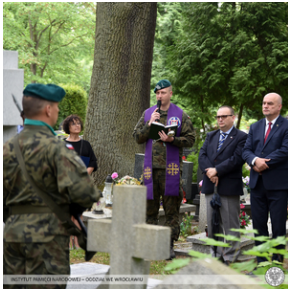
Poświęcenie nowego nagrobka żołnierza z Monte Cassino