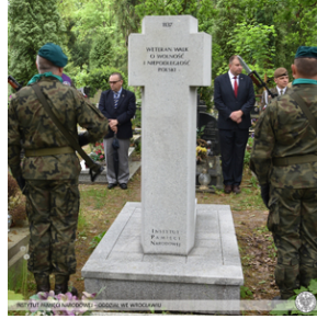
Poświęcenie nowego nagrobka żołnierza z Monte Cassino