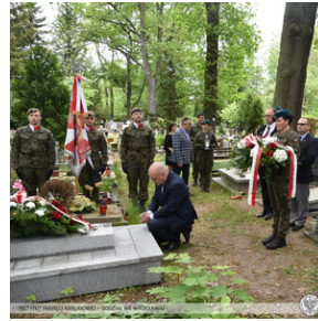
Poświęcenie nowego nagrobka żołnierza z Monte Cassino