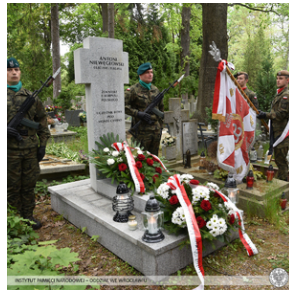
Poświęcenie nowego nagrobka żołnierza z Monte Cassino