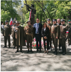
Odstąpienie pomnika plut. Emilia Czecha, trębacza z Monte Cassino - Kłodzko, 18 maja 2022