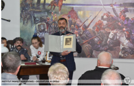
INSTYTUT PAMIĘCI NARODOWEJ – DELEGATURA W OPOLE