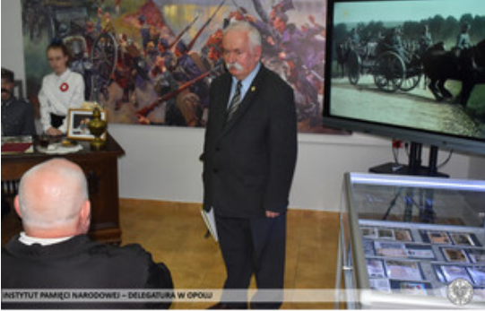
INSTYTUT PAMIĘCI NARODOWEJ – DELEGATURA W OPOLE