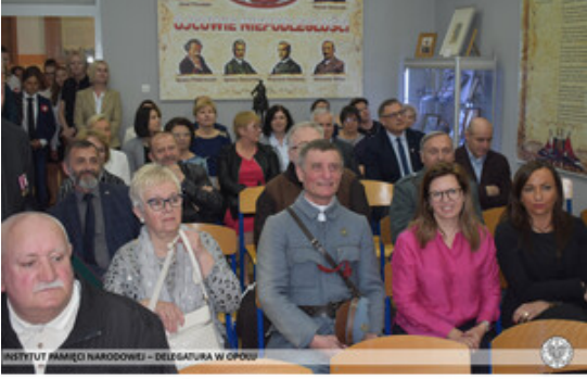
INSTYTUT PAMIĘCI NARODOWEJ – DELEGATURA W OPOLE