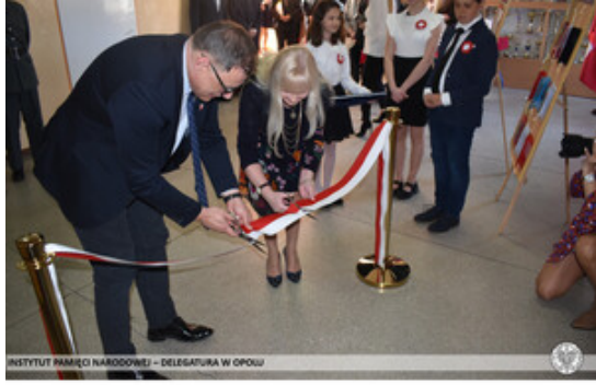
INSTYTUT PAMIĘCI NARODOWEJ – DELEGATURA W OPOLE