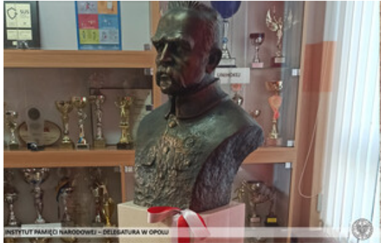
INSTYTUT PAMIĘCI NARODOWEJ – DELEGATURA W OPOLE