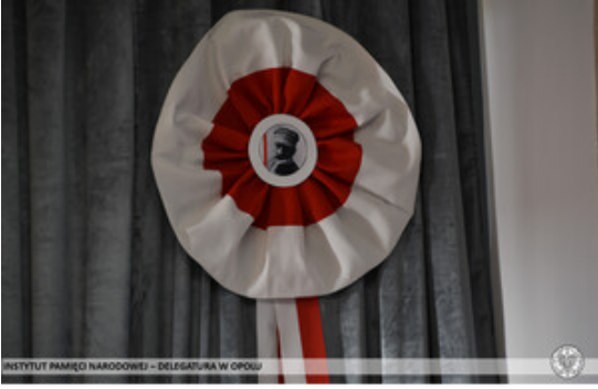
INSTYTUT PAMIĘCI NARODOWEJ – DELEGATURA W OPOLE