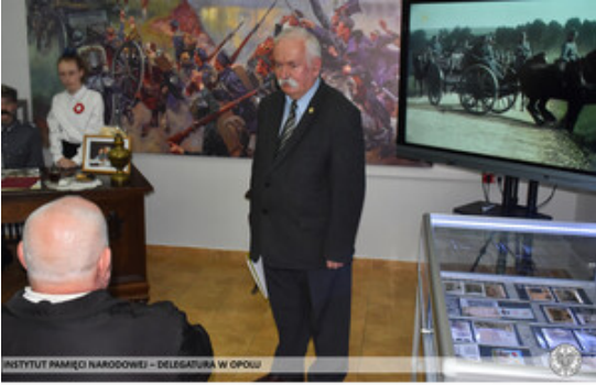
INSTYTUT PAMIĘCI NARODOWEJ – DELEGATURA W OPOLE