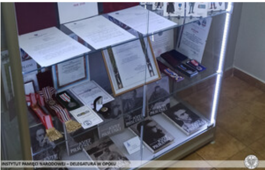
INSTYTUT PAMIĘCI NARODOWEJ – DELEGATURA W OPOLE