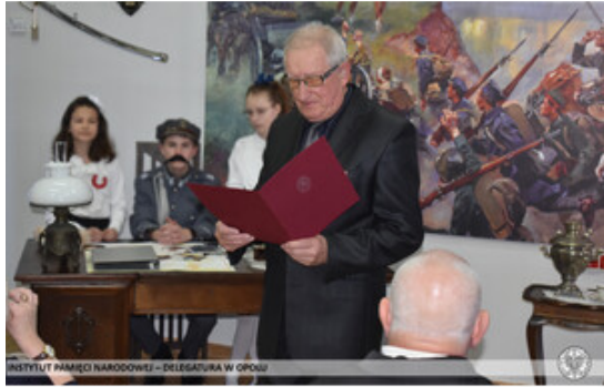
INSTYTUT PAMIĘCI NARODOWEJ – DELEGATURA W OPOLE