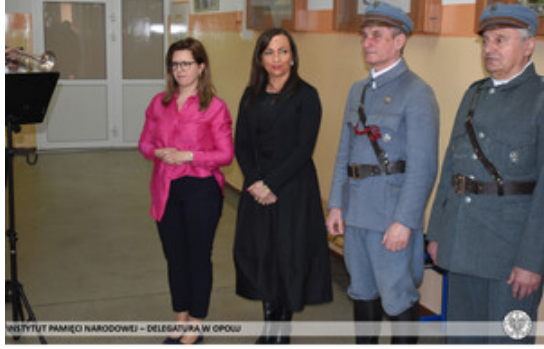
INSTYTUT PAMIĘCI NARODOWEJ – DELEGATURA W OPOLE