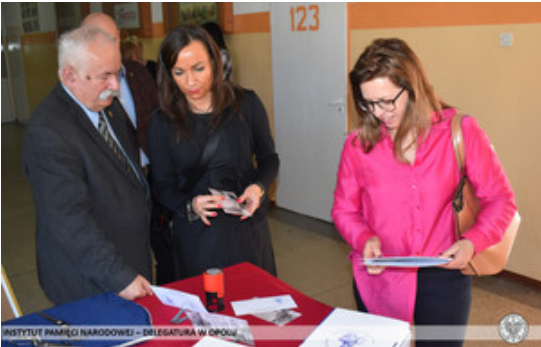
INSTYTUT PAMIĘCI NARODOWEJ – DELEGATURA W OPOLE