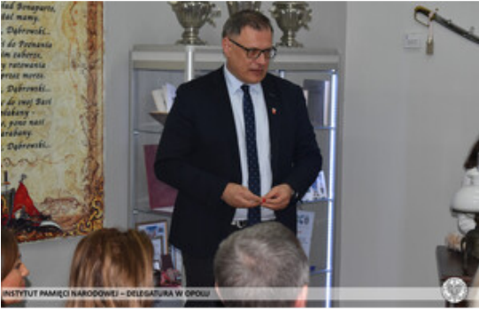
INSTYTUT PAMIĘCI NARODOWEJ – DELEGATURA W OPOLE