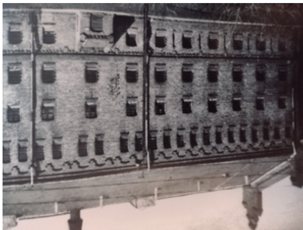
Więzienie na Mokotowie; [w:] Śladami zbrodni,