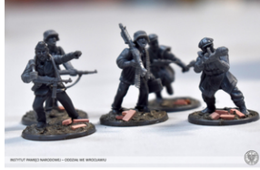
„Modele powstałe z historii”, 22-24 lutego 2022 r.