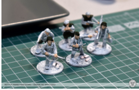
„Modele powstałe z historii”, 22-24 lutego 2022 r.