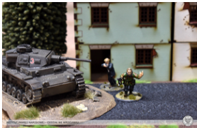
„Modele powstałe z historii”, 22-24 lutego 2022 r.