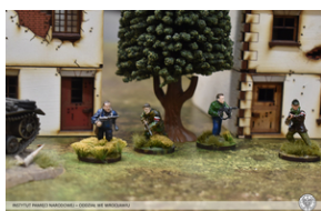
„Modele powstałe z historii”, 22-24 lutego 2022 r.