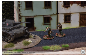
„Modele powstałe z historii”, 22-24 lutego 2022 r.