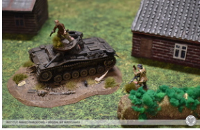
„Modele powstałe z historii”, 22-24 lutego 2022 r.