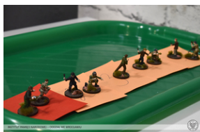
„Modele powstałe z historii”, 22-24 lutego 2022 r.