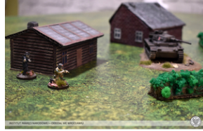
„Modele powstałe z historii”, 22-24 lutego 2022 r.