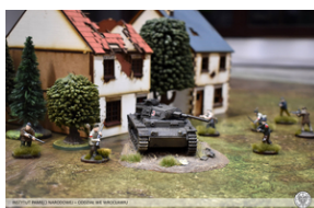
„Modele powstałe z historii”, 22-24 lutego 2022 r.