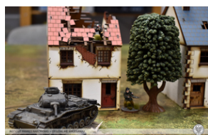
„Modele powstałe z historii”, 22-24 lutego 2022 r.

Przypominamy, że w księgarni IPN na placu Solnym nadal można obejrzeć dioramę, wykonaną przy udziale uczestników „Modeli powstałych z historii”. Naprawdę warto!