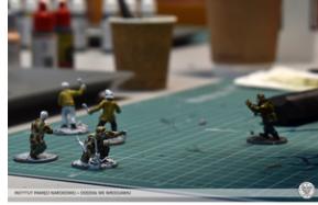
„Modele powstałe z historii”, 22-24 lutego 2022 r.