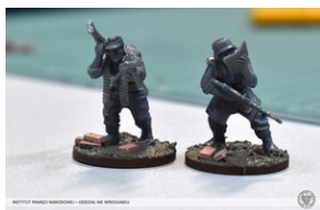
„Modele powstałe z historii”, 22-24 lutego 2022 r.