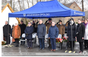
Odsłonięcie tablicy poświęconej ofiarom „Marszu Śmierci”