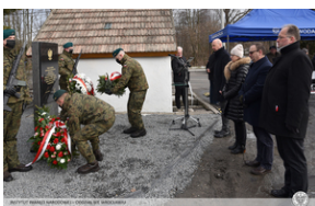
Odsłonięcie tablicy poświęconej ofiarom „Marszu Śmierci”