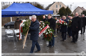
Odsłonięcie tablicy poświęconej ofiarom „Marszu Śmierci”