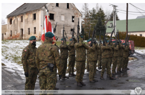
Odsłonięcie tablicy poświęconej ofiarom „Marszu Śmierci”