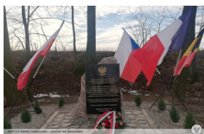
Złożenie kwiatów przez OBUWIM IPN we Wrocławiu pod tablicą upamiętniającą miejsce śmierci ofiar „Marszu Śmierci” w Starym Lesie