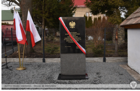
Odsłonięcie tablicy poświęconej ofiarom „Marszu Śmierci”