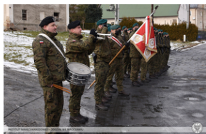
Odsłonięcie tablicy poświęconej ofiarom „Marszu Śmierci”