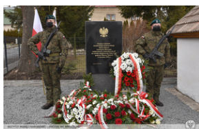
Odsłonięcie tablicy poświęconej ofiarom „Marszu Śmierci”