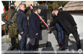
Odsłonięcie tablicy poświęconej ofiarom „Marszu Śmierci”