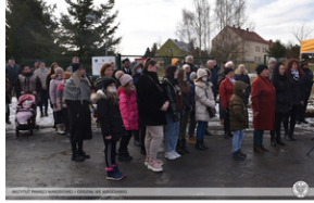
Odsłonięcie tablicy poświęconej ofiarom „Marszu Śmierci”