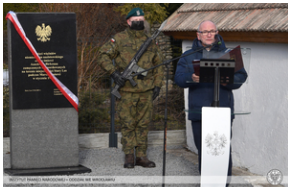
Odsłonięcie tablicy poświęconej ofiarom „Marszu Śmierci”