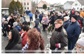
Odsłonięcie tablicy poświęconej ofiarom „Marszu Śmierci”