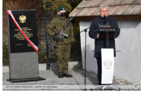
Odsłonięcie tablicy poświęconej ofiarom „Marszu Śmierci”