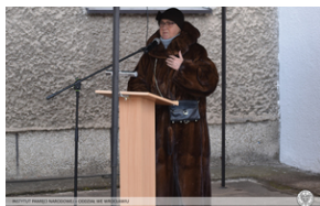
Odsłonięcie tablicy upamiętniającej działaczy antykomunistycznych - Nysa, 12 grudnia 2021