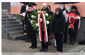
Odsłonięcie tablicy upamiętniającej działaczy antykomunistycznych - Opole, 13 grudnia 2021