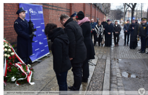
Odsłonięcie tablicy upamiętniającej działaczy antykomunistycznych - Świdnica, 13 grudnia 2021