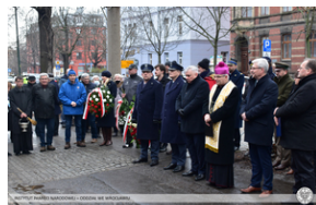
Odsłonięcie tablicy upamiętniającej działaczy antykomunistycznych - Świdnica, 13 grudnia 2021