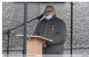
Odsłonięcie tablicy upamiętniającej działaczy antykomunistycznych - Nysa, 12 grudnia 2021