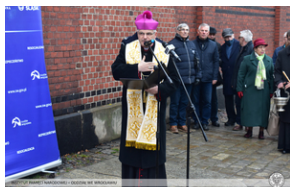
Odsłonięcie tablicy upamiętniającej działaczy antykomunistycznych - Świdnica, 13 grudnia 2021