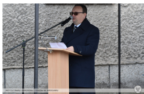
Odsłonięcie tablicy upamiętniającej działaczy antykomunistycznych - Nysa, 12 grudnia 2021