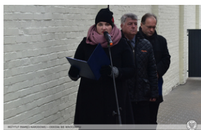
Odsłonięcie tablicy upamiętniającej działaczy antykomunistycznych - Opole, 13 grudnia 2021