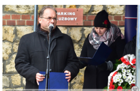
Odsłonięcie tablicy upamiętniającej działaczy antykomunistycznych - Strzelce Opolskie, 14 grudnia 2021