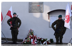
Odsłonięcie tablicy upamiętniającej działaczy antykomunistycznych - Nysa, 12 grudnia 2021