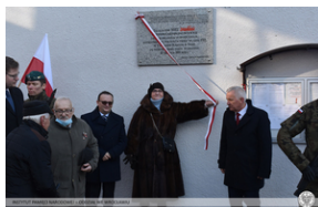
Odsłonięcie tablicy upamiętniającej działaczy antykomunistycznych - Nysa, 12 grudnia 2021