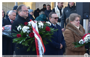
Odsłonięcie tablicy upamiętniającej działaczy antykomunistycznych - Nysa, 12 grudnia 2021