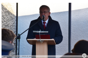
Odsłonięcie tablicy upamiętniającej działaczy antykomunistycznych - Nysa, 12 grudnia 2021