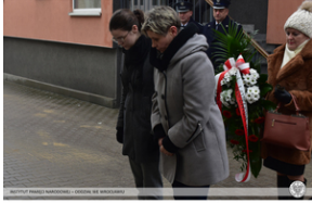
Odsłonięcie tablicy upamiętniającej działaczy antykomunistycznych - Opole, 13 grudnia 2021