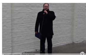
Odsłonięcie tablicy upamiętniającej działaczy antykomunistycznych - Opole, 13 grudnia 2021