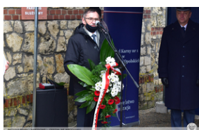
Odsłonięcie tablicy upamiętniającej działaczy antykomunistycznych - Strzelce Opolskie, 14 grudnia 2021