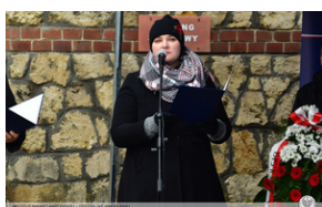
Odsłonięcie tablicy upamiętniającej działaczy antykomunistycznych - Strzelce Opolskie, 14 grudnia 2021