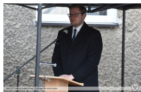
Odsłonięcie tablicy upamiętniającej działaczy antykomunistycznych - Nysa, 12 grudnia 2021