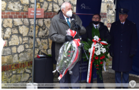
Odsłonięcie tablicy upamiętniającej działaczy antykomunistycznych - Strzelce Opolskie, 14 grudnia 2021