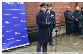
Odsłonięcie tablicy upamiętniającej działaczy antykomunistycznych - Świdnica, 13 grudnia 2021