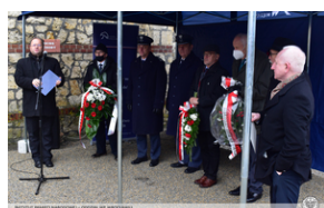
Odsłonięcie tablicy upamiętniającej działaczy antykomunistycznych - Strzelce Opolskie, 14 grudnia 2021