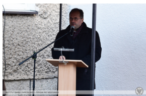
Odsłonięcie tablicy upamiętniającej działaczy antykomunistycznych - Nysa, 12 grudnia 2021