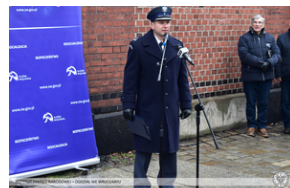
Odsłonięcie tablicy upamiętniającej działaczy antykomunistycznych - Świdnica, 13 grudnia 2021