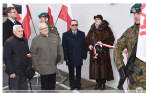
Odsłonięcie tablicy upamiętniającej działaczy antykomunistycznych - Nysa, 12 grudnia 2021