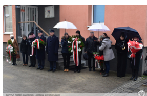
Odsłonięcie tablicy upamiętniającej działaczy antykomunistycznych - Opole, 13 grudnia 2021