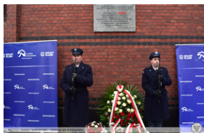
Odsłonięcie tablicy upamiętniającej działaczy antykomunistycznych - Świdnica, 13 grudnia 2021