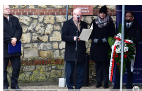
Odsłonięcie tablicy upamiętniającej działaczy antykomunistycznych - Strzelce Opolskie, 14 grudnia 2021