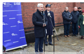
Odsłonięcie tablicy upamiętniającej działaczy antykomunistycznych - Świdnica, 13 grudnia 2021