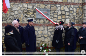
Odsłonięcie tablicy upamiętniającej działaczy antykomunistycznych - Strzelce Opolskie, 14 grudnia 2021