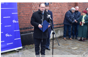
Odsłonięcie tablicy upamiętniającej działaczy antykomunistycznych - Świdnica, 13 grudnia 2021