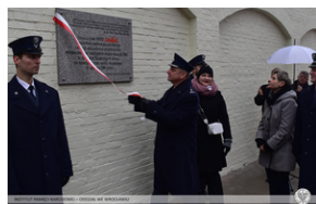
Odsłonięcie tablicy upamiętniającej działaczy antykomunistycznych - Opole, 13 grudnia 2021