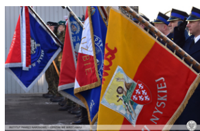
Odsłonięcie tablicy upamiętniającej działaczy antykomunistycznych - Nysa, 12 grudnia 2021