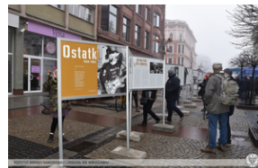
Wystawa „«Chodźcie z nami». Wrocławskie protesty uliczne 1981-1989”