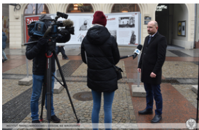
Wystawa „«Chodźcie z nami». Wrocławskie protesty uliczne 1981-1989”