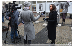
Wystawa „«Chodźcie z nami». Wrocławskie protesty uliczne 1981-1989”