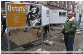
Wystawa „«Chodźcie z nami». Wrocławskie protesty uliczne 1981-1989”