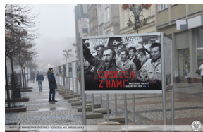
Wystawa „«Chodźcie z nami». Wrocławskie protesty uliczne 1981-1989”