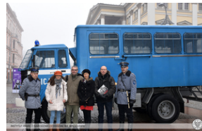
Wystawa „«Chodźcie z nami». Wrocławskie protesty uliczne 1981-1989”