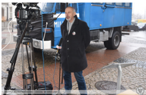
Wystawa „«Chodźcie z nami». Wrocławskie protesty uliczne 1981-1989”