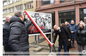
Otwarcie wystawy „«Chodźcie z nami». Wrocławskie protesty uliczne 1981-1989”