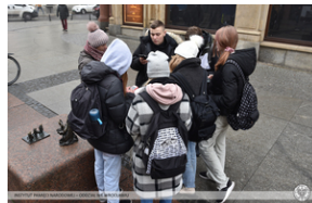
Wystawa „«Chodźcie z nami». Wrocławskie protesty uliczne 1981-1989”