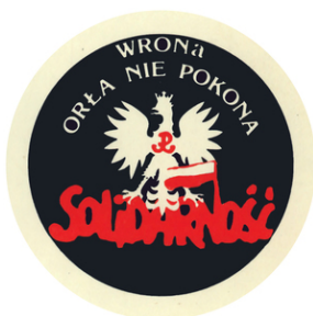
Wlepki z okazji 40. rocznicy wprowadzenia w Polsce stanu wojennego