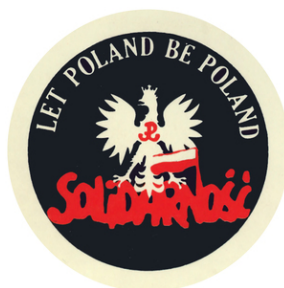
Wlepki z okazji 40. rocznicy wprowadzenia w Polsce stanu wojennego