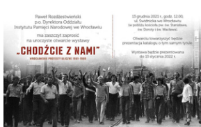
Zaproszenie na wystawę „«Chodźcie z nami». Wrocławskie protesty uliczne 1981-1989”

godz. 12:30-18:00 – gra edukacyjno-historyczna realizowana na terenie Wrocławia pt. „Stan Wojenny Wrocław 1981”. Gra składa się z 12 punktów (10 obsługowe, 2 bezobsługowe), na których zespoły będą musiały rozwiązać proste zadania związane z dziejami stanu wojennego, wykonać pewne czynności lub poznać historię danego wydarzenia. Punkty będą rozmieszczone na terenie wokół wystawy IPN „«Chodźcie z nami». Wrocławskie protesty uliczne 1981–1989” (ul. Świdnicka). Czas przejścia całej gry – ok. 1-2 h.