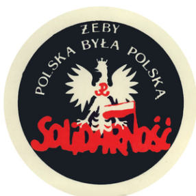
Wlepki z okazji 40. rocznicy wprowadzenia w Polsce stanu wojennego