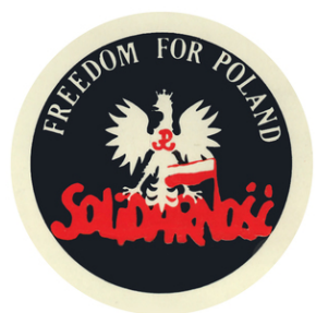
Wlepki z okazji 40. rocznicy wprowadzenia