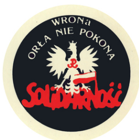
Wlepki z okazji 40. rocznicy wprowadzenia w Polsce stanu wojennego