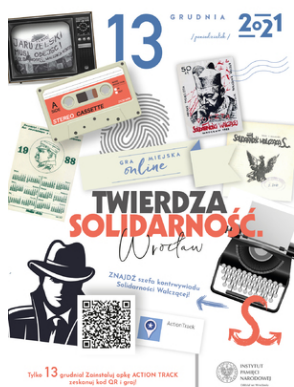
Gra Miejska online „Twierdza Solidarność. Wrocław”

gra będzie osiągalna w późniejszym terminie, po zlurowaniu obostrzeń pandemicznych. Kod QR do rozpoczęcia gry znajduje się w pliku PDF na dole strony.