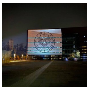
Próba generalna projekcji na Narodowym Forum Muzyki

godz. 19:30 – wielkoformatowy pokaz specjalny filmu IPN „Stan wojenny. Historia oporu” na fasadzie budynku Narodowego Forum Muzyki (pl. Wolności).