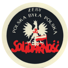
Wlepki z okazji 40. rocznicy wprowadzenia w Polsce stanu wojennego