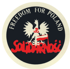
Wlepki z okazji 40. rocznicy wprowadzenia w Polsce stanu