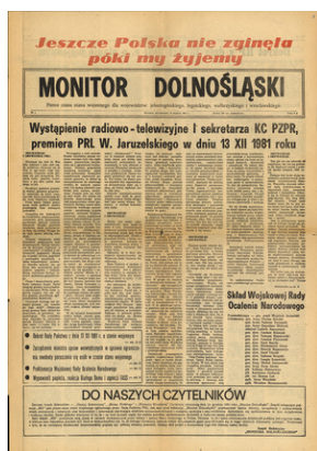
Gazeta stanu wojennego na Dolnym Śląsku (Archiwum IPN, sygn. IPN-Wr-143-48)

„Obywatelki i Obywatele Polskiej Rzeczypospolitej Ludowej! Zwracam się dziś do was jako żołnierz i jako szef rządu polskiego. Zwracam się do was w sprawach wagi najwyższej. Ojczyzna nasza znalazła się nad przepaścią...” - tak rozpoczął się oficjalny komunikat gen. Jaruzelskiego nadawany za pośrednictwem radia i telewizji 13 grudnia 1981 r. Zapraszamy do relacji o wydarzeniach upamiętniających wprowadzenie stanu wojennego w Jelczu-Laskowicach, Nysie, Opolu, Świdnicy, Wołowie i Wrocławiu.