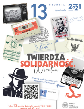
Gra Miejska online „Twierdza Solidarność. Wrocław”

gra będzie osiągalna w późniejszym terminie, po zlurowaniu obostrzeń pandemicznych. Kod QR do rozpoczęcia gry znajduje się w pliku PDF na dole strony.