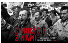
Zaproszenie na wystawę „«Chodźcie z nami». Wrocławskie protesty uliczne 1981-1989”

godz. 12:00 – otwarcie wystawy przygotowanej przez Oddział Biuro Badań Historycznych i Oddziałowe Biuro Edukacji Narodowej IPN we Wrocławiu „«Chodźcie z nami». Wrocławskie protesty uliczne 1981–1989” oraz prezentacja towarzyszącego jej katalogu (ul. Świdnicka, w pobliżu kościoła pw. św. Stanisława, św. Doroty i św. Wacława).