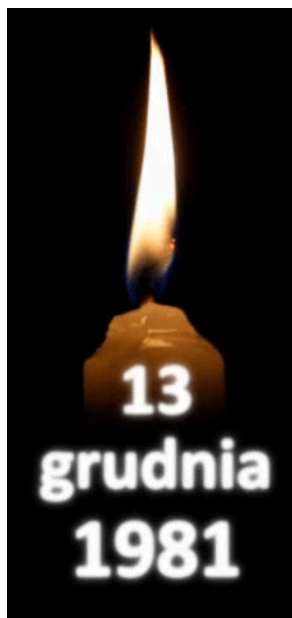
Zapał Światło Wolności

godz. 19:30 – ogólnopolska akcja Instytutu Pamięci Narodowej „Zapał Światło Wolności” (zapalenie zniczy ku czci ofiar stanu wojennego na pl. Wolności i pl. Katedralnym). Uczestnicy otrzymają okolicznościowe wlepki „Żeby Polska była Polską” lub „Wrona orła nie pokona”. Relacja z zapalenia Światła Wolności i wielkoformatowych projekcji filmowych.