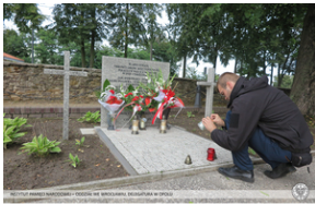
Grób zbiorowy żołnierzy WP i funkcjonariuszy Straży Granicznej poległych 1 września w okolicy Praszki.