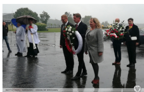
Uroczystości w Polskiej Nowej Wsi pod Opolem

O godzinie 17.00 z płyty lotniska wystartował tradycyjny już Bieg Pamięci. Uczestnicy biegu, pokonali trasę 110 km z Polskiej Nowej Wsi do Wielunia, dając w ten sposób wyraz swojej pamięci o wydarzeniach sprzed 82 lat. Dalsze obchody 82 rocznicy wybuchu II wojny światowej z udziałem pracowników IPN odbyły się w Wieluniu, z udziałem najwyższych władz państwowych.