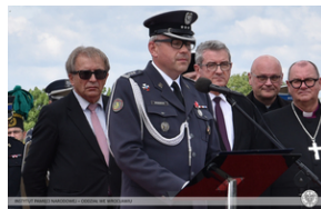
Wrocław - obchody na Cmentarzu Żołnierzy Polskich we Wrocławiu