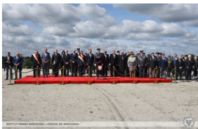
Wrocław - obchody na Cmentarzu Żołnierzy Polskich we Wrocławiu