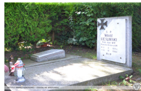
Uroczystości w Polanicy-Zdroju