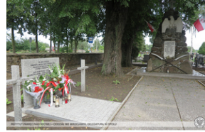
Grób zbiorowy żołnierzy WP i funkcjonariuszy Straży Granicznej poległych 1 września w okolicy Praszki.