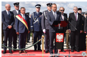
Wrocław - obchody na Cmentarzu Żołnierzy Polskich we Wrocławiu