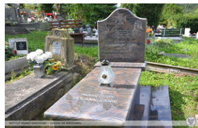
Uroczystości w Polanicy-Zdroju