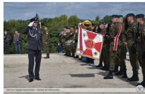
Wrocław - obchody na Cmentarzu Żołnierzy Polskich we Wrocławiu