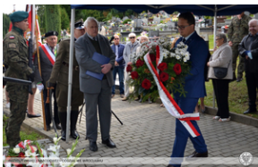
Uroczystości w Polanicy-Zdroju