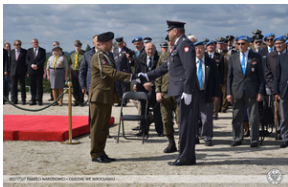
Wrocław - obchody na Cmentarzu Żołnierzy Polskich we Wrocławiu