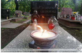
Zapalenie zniczy na grobie Eugeniusza Grabowskiego, obrońcy Westerplatte.