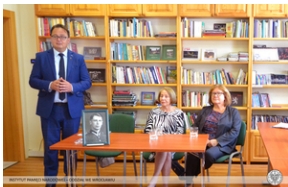
Uroczystości w Polanicy-Zdroju