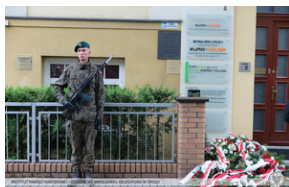
Złożenie kwiatów przy dawnym Konsulacie Generalnym RP w Opolu.