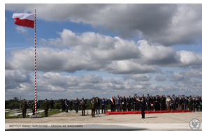
Wrocław - obchody na Cmentarzu Żołnierzy Polskich we Wrocławiu