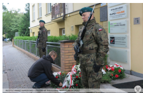
Złożenie kwiatów przy dawnym Konsulacie Generalnym RP w Opolu.