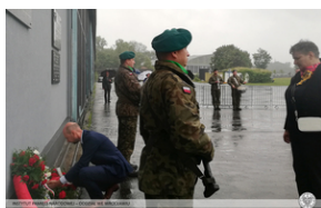
Uroczystości w Polskiej Nowej Wsi pod Opolem