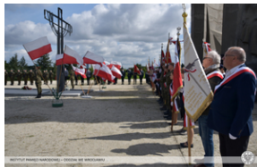
Wrocław - obchody na Cmentarzu Żołnierzy Polskich we Wrocławiu