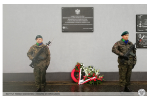
Uroczystości w Polskiej Nowej Wsi pod Opolem