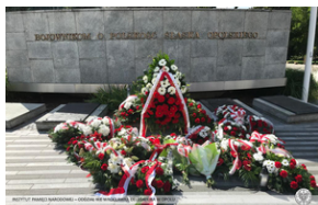
Pomnik Bojownikom o polskość Śląska Opolskiego w Opolu.