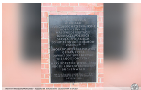
Tablica upamiętniająca Polaków deportowanych do KL Buchenwald, Dworzec kolejowy Opole Główne.