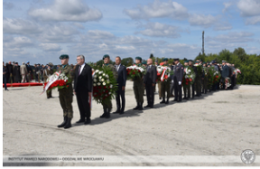
Wrocław – obchody na Cmentarzu Żołnierzy Polskich we Wrocławiu