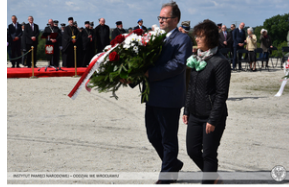
Wrocław – obchody na Cmentarzu Żołnierzy Polskich we Wrocławiu