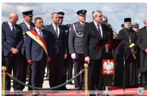
Wrocław - obchody na Cmentarzu Żołnierzy Polskich we Wrocławiu