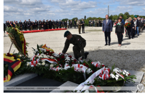
Wrocław – obchody na Cmentarzu Żołnierzy Polskich we Wrocławiu