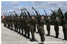
Wrocław - obchody na Cmentarzu Żołnierzy Polskich we Wrocławiu