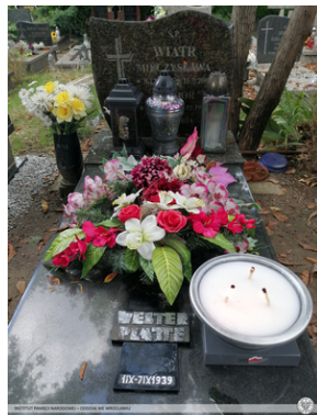
Zapalenie zniczy na grobie Teodora Wiatra, obrońcy Westerplatte.