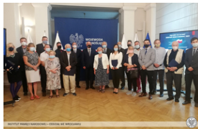
Uroczystość wręczenia dyplomów rodzinom bohaterów uhonorowanych w ramach projektu „Ocalamy”.