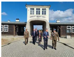
Złożenie kwiatów na terenie KL Gross-Rosen w Rogoźnicy, fot. R. Adamus (DUW).