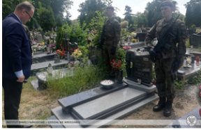
Hołd pamięci więźniów pochowanych we Wrocławiu oraz w Warbrzyczu.