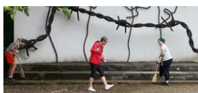
Sprzątanie filii dawnego obozu koncentracyjnego Auschwitz w Sławięcicach, fot. R. Wojciechowska (IPN).

W sobotę 12 czerwca 2021 r. z inicjatywy Delegatury IPN w Opolu grupa wolontariuszy ze Stowarzyszenia Patriotyczny Kędzierzyn-Koźle i Podosudeckiego Związku Drużyn Harcerek ZHR porządkowała teren filii dawnego obozu koncentracyjnego KL Auschwitz w Sławięcicach we wschodniej części Kędzierzyna-Koźła. Okazją do podjęcia prac była chęć przypomnienia o pierwszym transporcie polskich więźniów do niemieckiego KL Auschwitz. Serdecznie dziękujemy wszystkim uczestnikom wydarzenia, szczególnie młodzieży. Zachęcamy do wysłuchania i obejrzenia relacji medialnych.