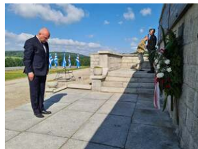
Złożenie kwiatów na terenie KL Gross-Rosen w Rogoźnicy, fot. R. Adamus (DUW).