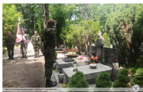
Hołd pamięci więźniów pochowanych we Wrocławiu oraz w Wałbrzychu.