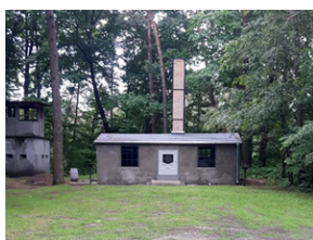
Filia dawnego obozu koncentracyjnego Auschwitz w Sławięcicach.