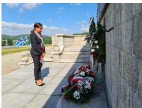
Złożenie kwiatów na terenie KL Gross-Rosen w Rogoźnicy, fot. R. Adamus (DUW).