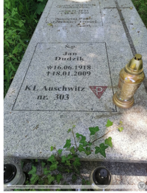
Hołd pamięci więźniów pochowanych we Wrocławiu oraz w Warbrzyczu.