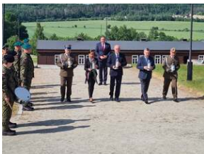
Złożenie kwiatów na terenie KL Gross-Rosen w Rogoźnicy, fot. R. Adamus (DUW).

Rocznica wywozu pierwszych Polaków do obozu koncentracyjnego Auschwitz była także okazją do spotkania się z byłymi więźniami KL Gross-Rosen.