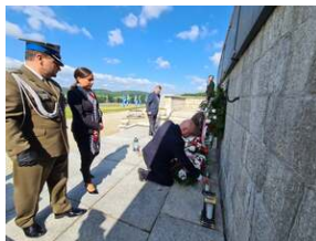
Złożenie kwiatów na terenie KL Gross-Rosen w Rogoźnicy, fot. R. Adamus (DUW).