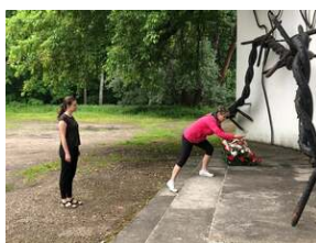
Filia dawnego obozu koncentracyjnego Auschwitz w Sławięcicach, fot. ZHR.