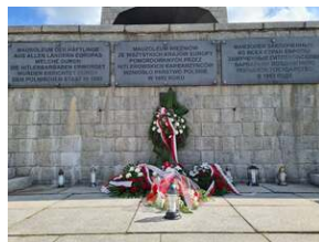
Złożenie kwiatów na terenie KL Gross-Rosen w Rogoźnicy, fot. R. Adamus (DUW).