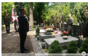
Hołd pamięci więźniów pochowanych we Wrocławiu oraz w Wałbrzychu.