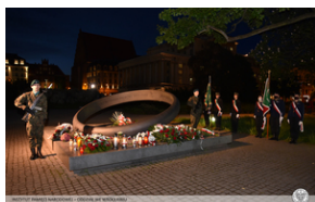
Znicz dla rotmistrza Pileckiego.