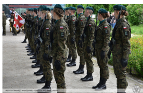
Uroczystości z okazji 73. rocznica zamordowania rotmistrza Witolda Pileckiego.