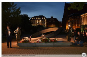
Znicz dla rotmistrza Pileckiego.