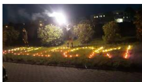
Znicze pamięci w godzinę śmierci rotmistrza Witolda Pileckiego w Kluczborku.