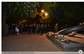
Znicz dla rotmistrza