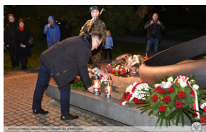
Znicz dla rotmistrza Pileckiego.