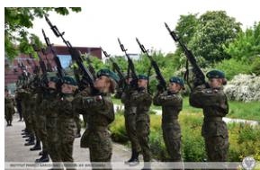
Uroczystości z okazji 73. rocznica zamordowania rotmistrza Witolda Pileckiego.