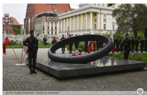
Uroczystości z okazji 73. rocznica zamordowania rotmistrza Witolda Pileckiego.

Bogusław Szpytma w kilku słowach nakreślił postać rotmistrza Witolda Pileckiego.