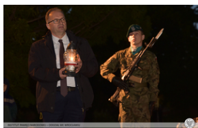
Znicz dla rotmistrza Pileckiego.