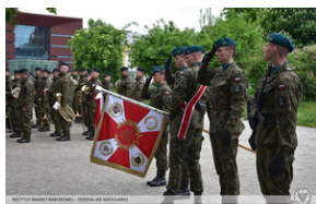
Uroczystości z okazji 73. rocznica zamordowania rotmistrza Witolda Pileckiego.