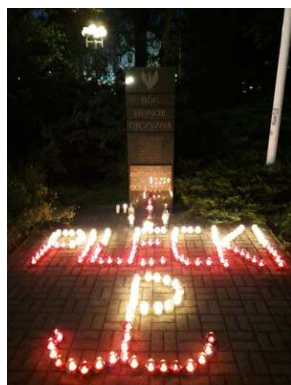
Znicze pamięci w godzinę śmierci rotmistrza Witolda