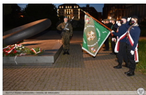
Znicz dla rotmistrza Pileckiego.