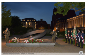
Znicz dla rotmistrza Pileckiego.