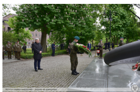
Uroczystości z okazji 73. rocznica zamordowania rotmistrza Witolda Pileckiego.