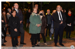
Znicz dla rotmistrza