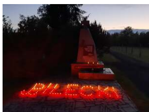
Znicze pamięci w godzinę śmierci rotmistrza Witolda Pileckiego w Łambinowicach.

Dziękujemy Stowarzyszeniu Odra-Niemen Oddział Opolski, Centralnemu Muzeum Jeńców Wojennych, ZHR Głubczyce, ZHR Głuchołazy, ZHR Opole, Biało-czerwonemu Opolu, Chorągwi Harcerzy Ziemi Opolskiej ZHR, Górnośląskiej Chorągwi Harcererek „Ad fontes” ZHR i wszystkim innym, którzy do nas dołączyli.