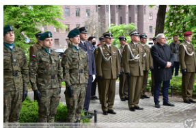
Uroczystości z okazji 73. rocznica zamordowania rotmistrza Witolda Pileckiego.