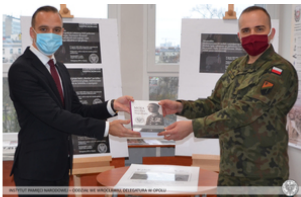
Oficerowie WP z wizytą w Delegaturze IPN w Opolu