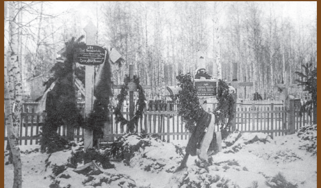
▲ 5. Dywizja Syberyjska. Groby poległych żołnierzy na cmentarzu w Nowonikołajewsku, 1919 r.