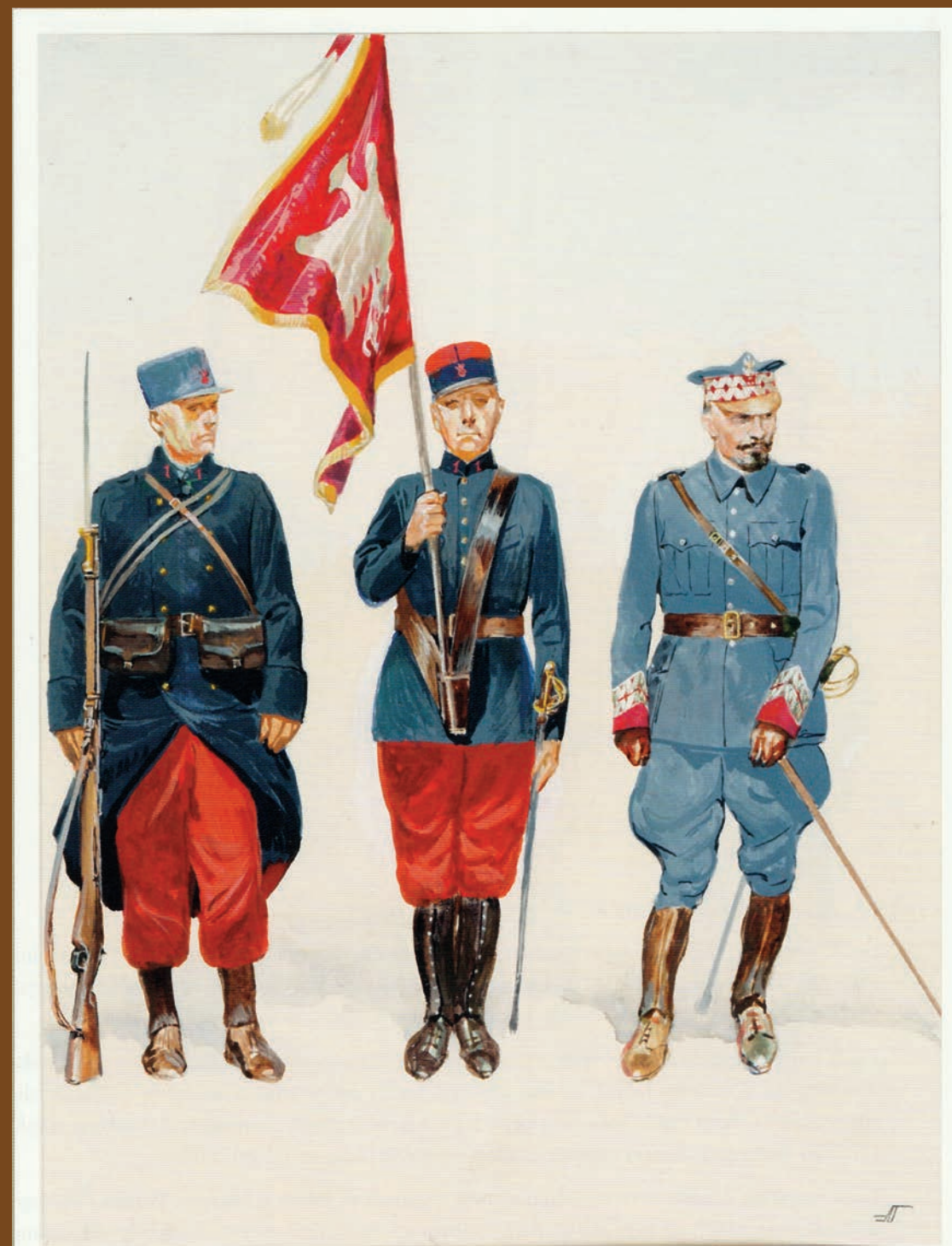
Piechota Legionu Bajorczyków i gen. Józef Haller