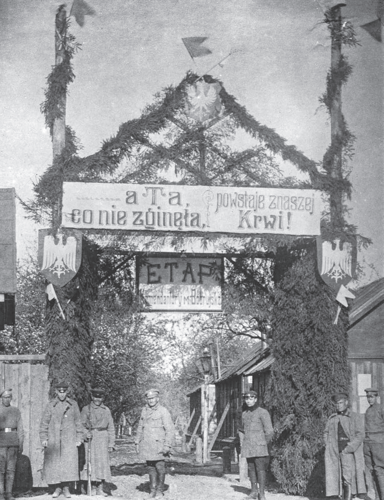
I Korpus Polski – uroczystości 3 Maja. Jedna z bram wzniesionych w Bobrujsku z okazji święta narodowego, 1918 r.