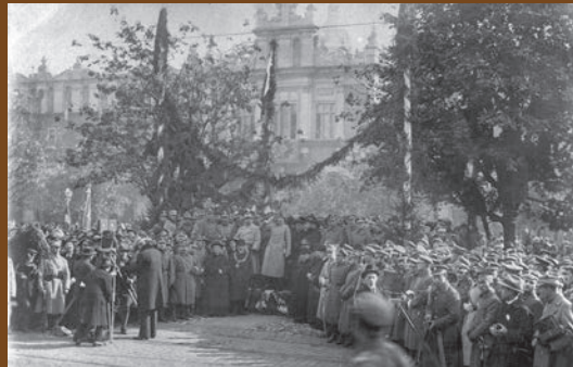
Święto Zjednoczenia Armii Polskiej. Józef Piłsudski i gen. Józef Haller, 1919 r. ▲