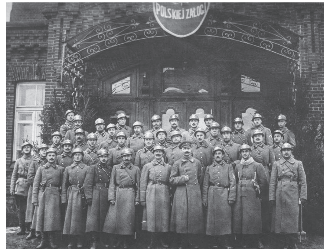
I Korpus Polski. Grupa oficerów 1. Pułku Inżynierii przed jednym z budynków twierdzy Bobrujsk

Najlepiej zorganizowana formacja polska w Rosji, I Korpus gen. Dowbora-Muśnickiego, była rozlokowana na Białorusi. W walkach z Czerwoną Gwardią na początku lutego 1918 r. Korpus zdobył twierdzę Bobrujsk, która stała się później główną bazą formacji. Korpus skutecznie walczył przeciwko bolszewikom, lecz 21 maja 1918 r. został rozbrojony przez oddziały niemieckie, a żołnierzy odesłano do Warszawy.