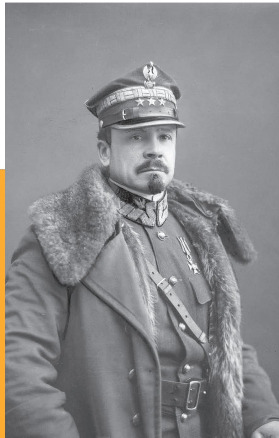
Generał Józef Haller, dowódca Armii Polskiej we Francji