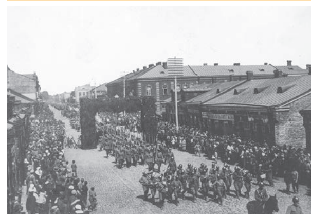
I Korpus Polski w czasie defilady wojskowej z okazji święta 3 Maja, Bobrujsk 1918 r.