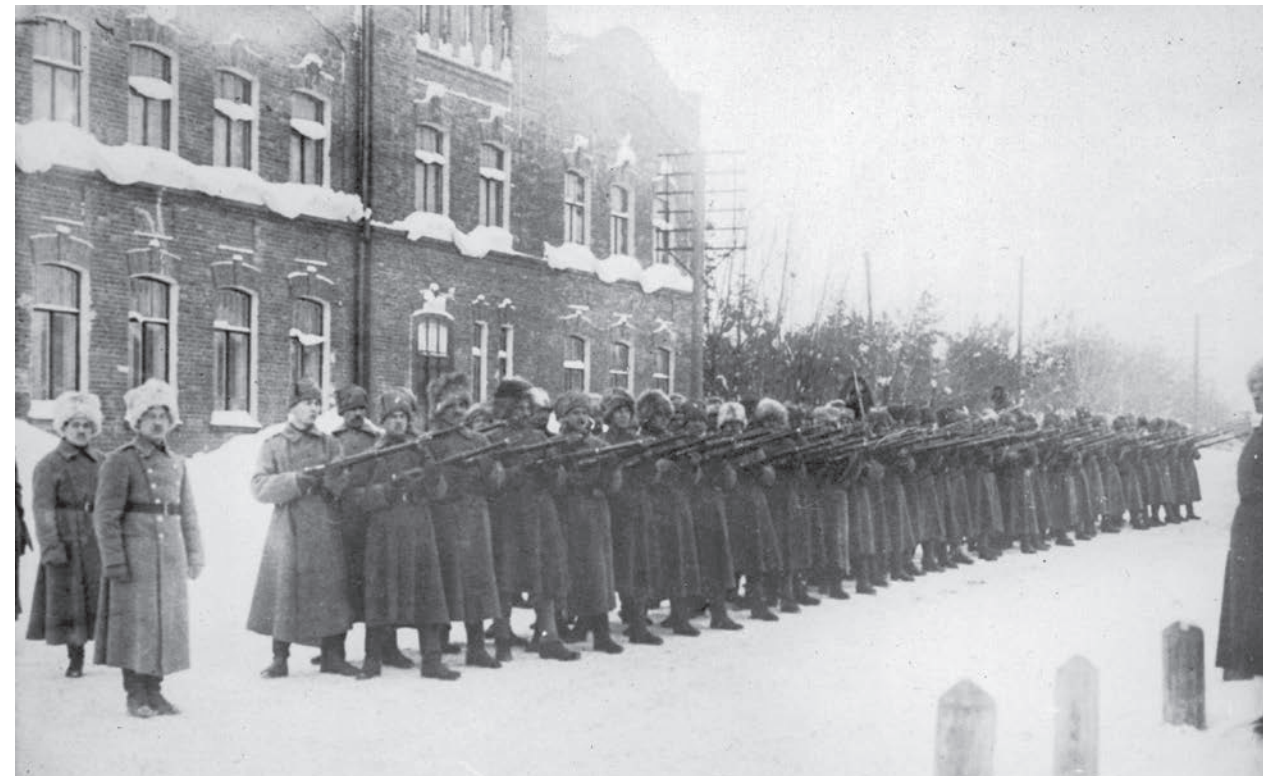
5. Dywizja Syberyjska. Ćwiczenia Szkoły Oficerskiej, 1918–1919 r.

Prezydent Republiki Francuskiej Raymond Poincaré powołał regularną armię polską dekretem z 4 czerwca 1917 r. Miała ona walczyć po stronie wojsk ententy pod własnymi sztandarami, lecz pod dowództwem francuskim. Pierwszym naczelnym dowódcą Armii Polskiej we Francji został gen. Louis Archinard. W związku ze zmianami z 28 września 1918 r. naczelną dowództwo objął 4 października 1918 r. gen. Józef Haller.