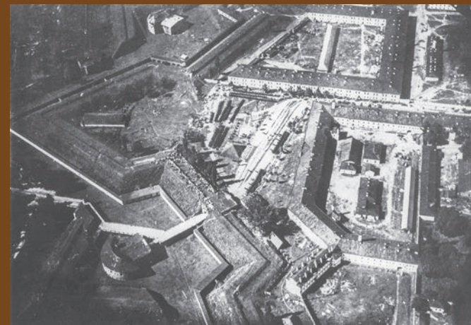
Twierdza w Bobrujsku, główne miejsce koncentracji I Korpusu w Rosji, zdjęcie lotnicze, 1920 r.

II Korpusem początkowo dowodził gen. Sylwester Stankiewicz, później gen. Władysław Glass, a następnie płk Józef Haller. Korpus ten, złożony częściowo z legionistów II Brygady, skapitulował przed Niemcami pod Kaniowem. III Korpus, którego dowódcą był gen. Eugeniusz de Henning-Michaelis, brał udział w walkach z oddziałami Czerwonej Gwardii na Ukrainie. Skapitulował przed Austriakami w czerwcu 1918 r.