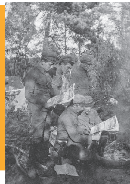
Oficerowie 5. Batalionu Legionów Polskich przeglądający prasę w lesie pod Dubniakami, 1916 r.