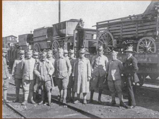
Transport oddziałów armii gen. Józefa Hallera z Francji do Polski, 1919 r. ▲▲