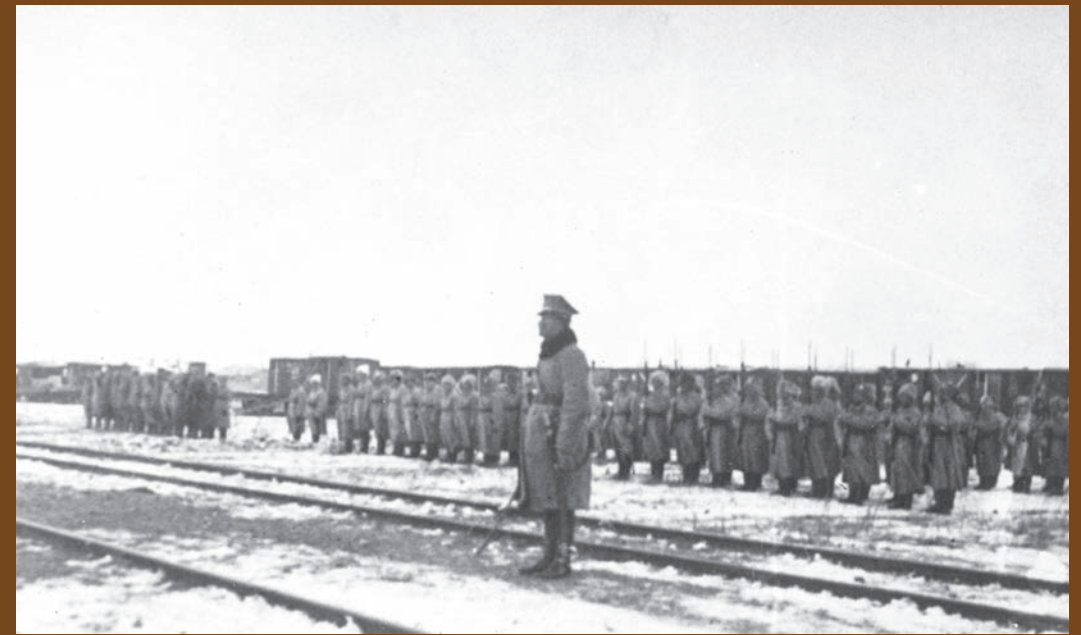
▲ 5. Dywizja Syberyjska. Oddziały polskie w Charbinie. Powitanie gen. Antoniego Baranowskiego przez pozostałych przy życiu żołnierzy Dywizji Syberyjskiej, marzec 1920 r.