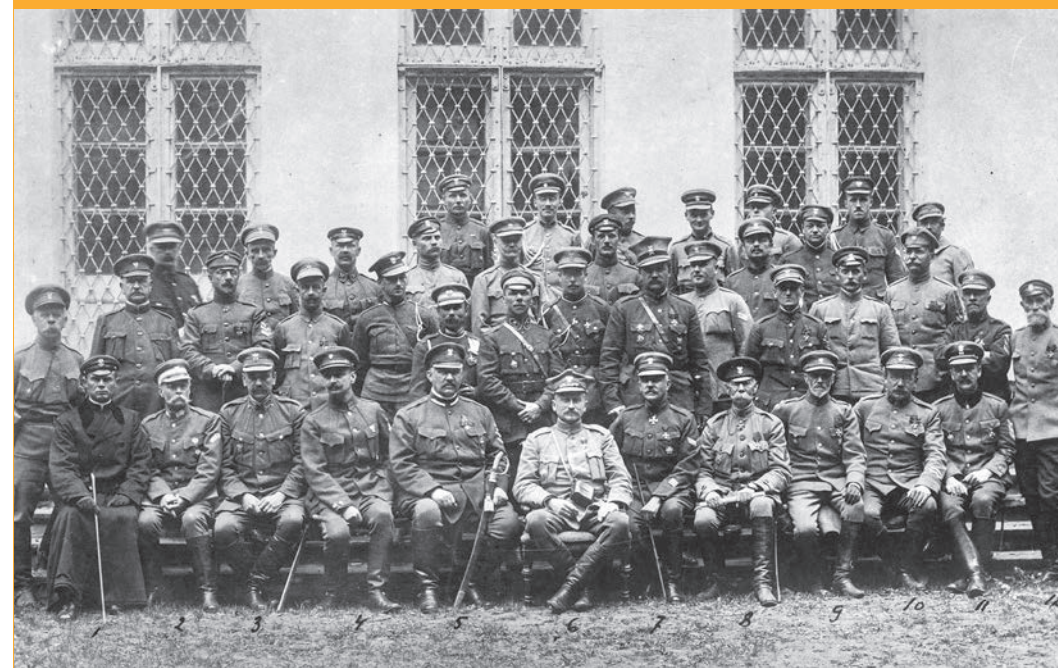
Dowódcy oddziałów I Korpusu Polskiego z gen. Józefem Dowborem-Muśnickim, Bobrujsk, 1918 r. (NAC)