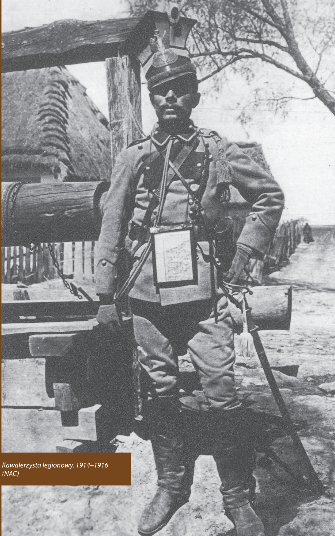
Kawalerzysta legionowy, 1914–1916 (NAC)