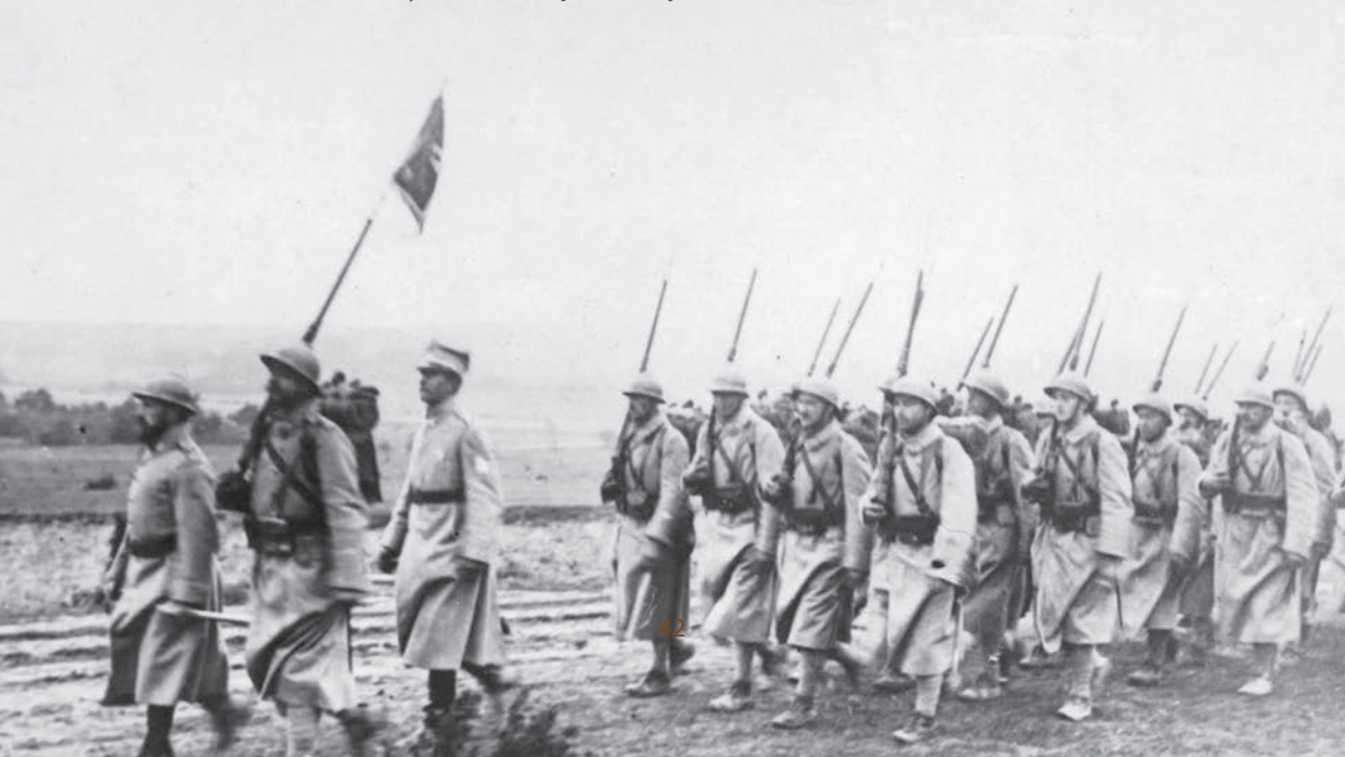
Oddziały Armii Polskiej we Francji w drodze na front, 1918 r.