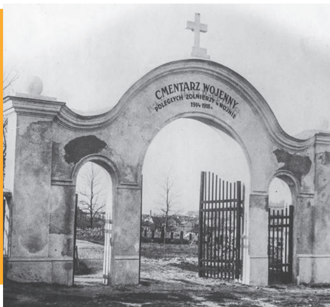
Lwów, cmentarz żołnierzy poległych w I wojnie światowej