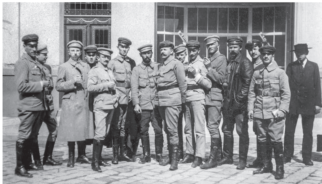
Rada Główna Związku Walki Czynnej, 1914 r.

W czerwcu 1908 r. Kazimierz Sosnkowski założył we Lwowie Związek Walki Czynnej, czyli konspiracyjną, ponadpartyjną organizację wojskową, której jawną emanacją były od 1910 r. Związek Strzelecki we Lwowie i Towarzystwo Strzeleckie w Krakowie. W 1912 r. powstała Komenda Główna ZWC (i Związków Strzeleckich) z Józefem Piłsudskim jako komendantem głównym.