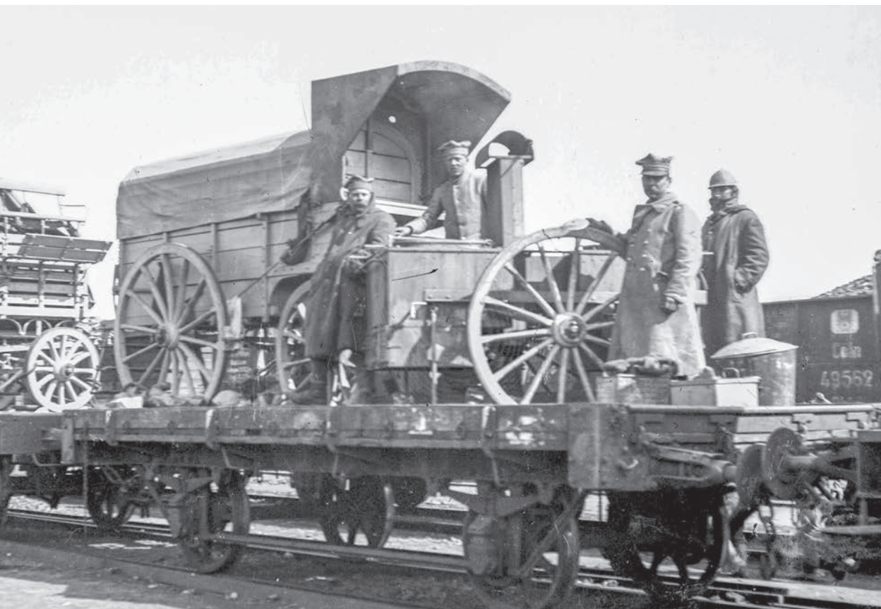
Transport oddziałów armii gen. Józefa Hallera z Francji do Polski, 1919 r.

Nabór do Armii Polskiej prowadzono we Francji, w Stanach Zjednoczonych, Kanadzie, Brazylii, a pod koniec 1917 r. władze francuskie zezwoliły na przyjmowanie jeńców – Polaków z armii państw centralnych, także z obozów jenieckich we Włoszech. Latem 1918 r. 1. Pułk Strzelców wziął udział w walkach w Szampanii, a w październiku 1. Dywizja Strzelców Polskich obsadziła samodzielnie odcinek frontu w Wohezach.