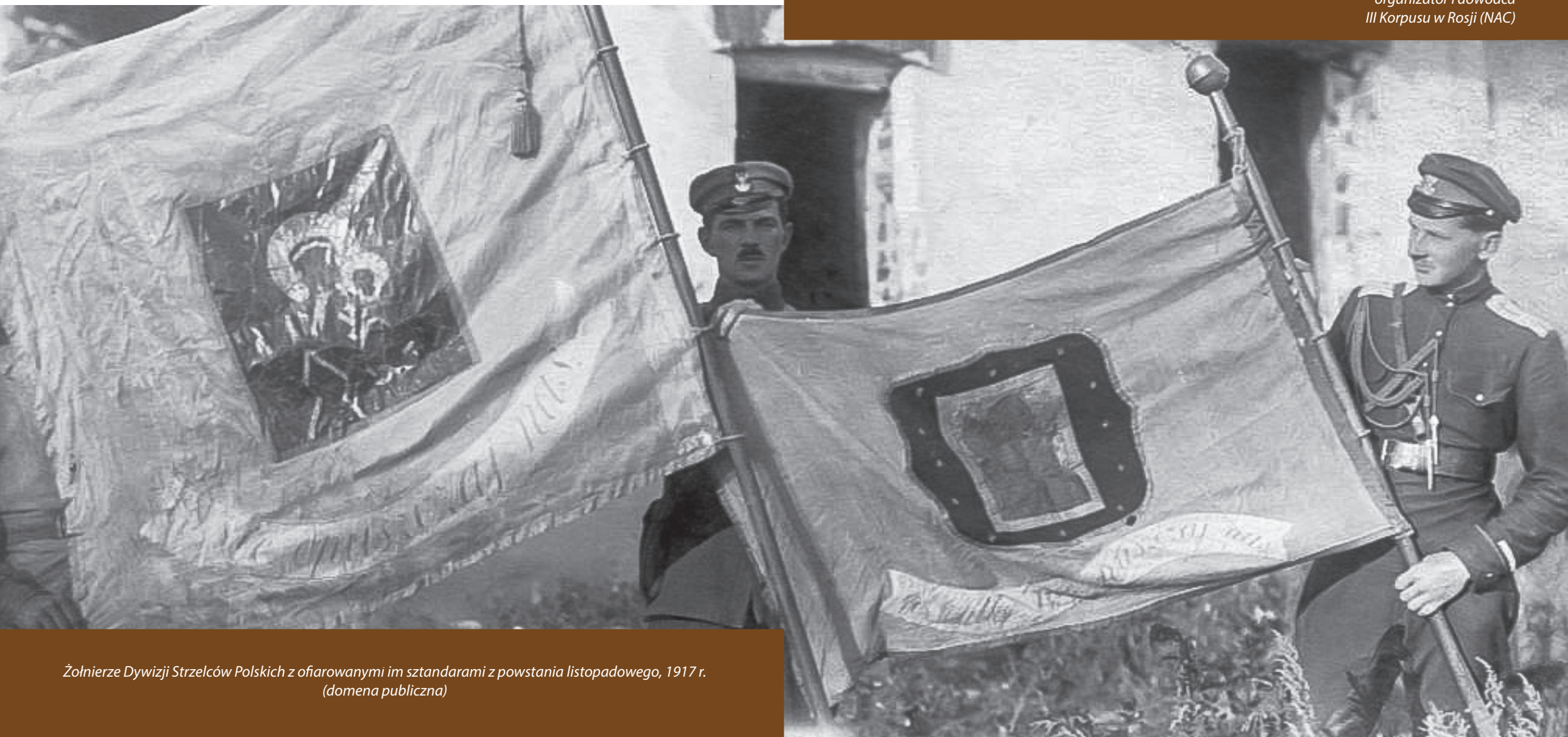
Żołnierze Dywizji Strzelców Polskich z ofiarowanymi im sztandarami z powstania listopadowego, 1917 r. (domena publiczna)