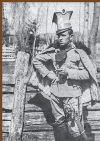
Ulan legionowy, 1914 r.