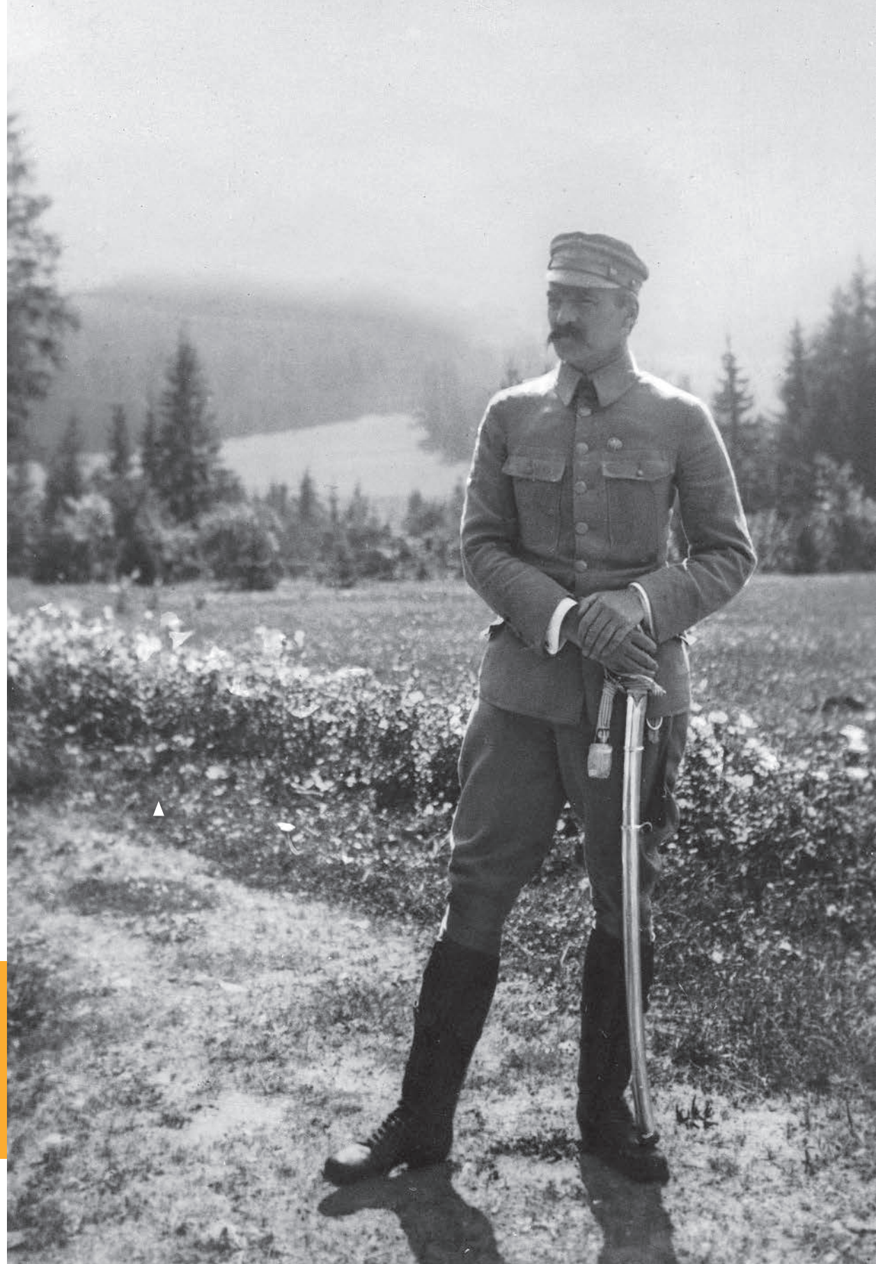
▶ Józef Piłsudski, brygadier Legionów Polskich, 1916 r. (NAC)