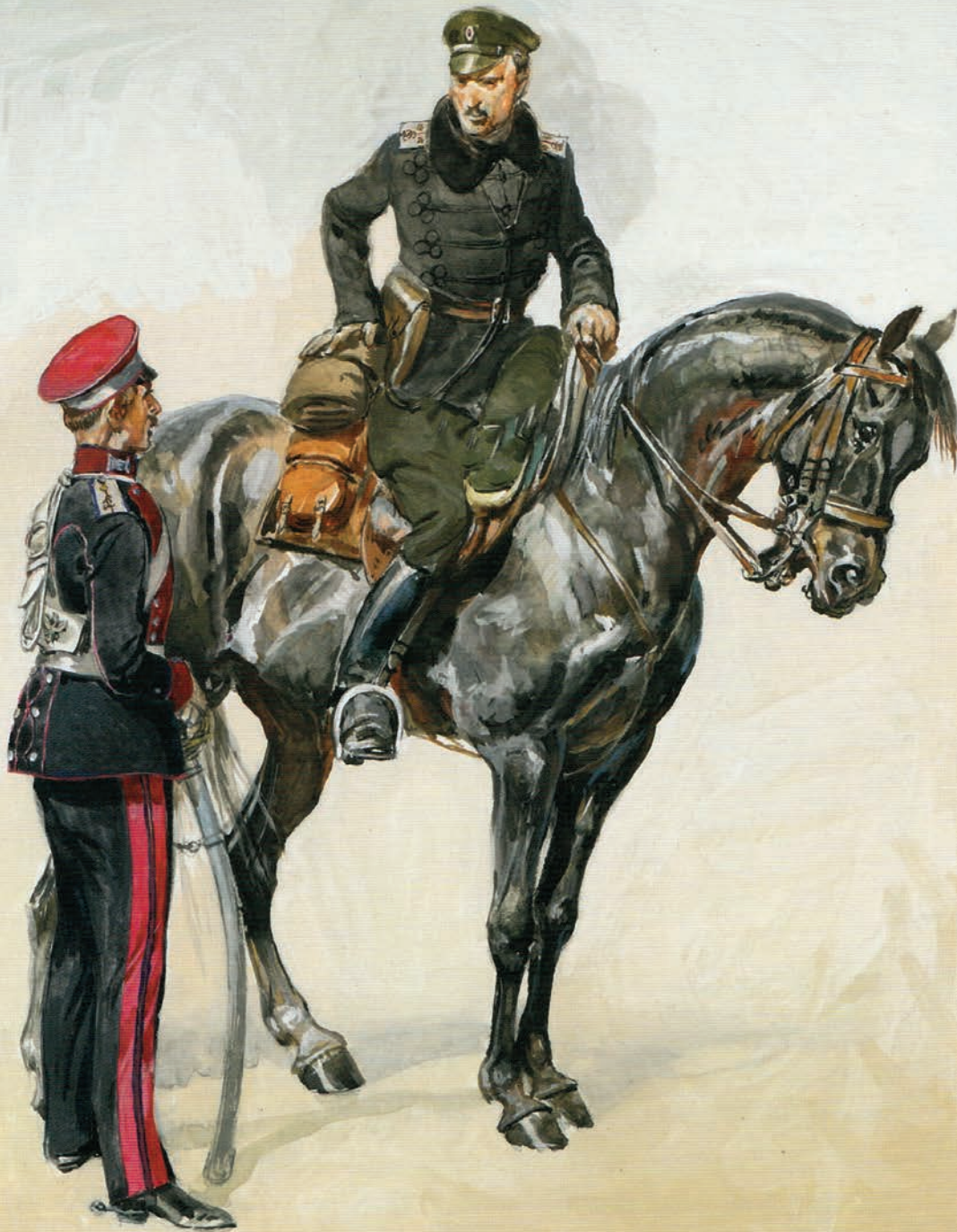
Kawalerzyści Legionu Puławskiego (ilustracja ze zbiorów Daniela Koresia)