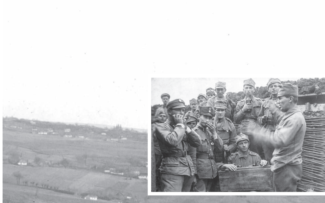
Polski Korpus Posiłkowy – pozycje pod Rarańczą. Budowa okopów przez saperów II Brygady Legionów, 1918 r.

W połowie sierpnia, już na terenie Królestwa Polskiego, dołączyły następne kompanie, z których sformowano 1. Pułk Legionów Polskich, przekształcony pod koniec roku w I Brygadę Legionów Polskich. W 1915 r. utworzono jeszcze brygady II i III. Walczyły one w Karpatach i na Wołyniu. W 1917 r. Piłsudski zerwał z państwami centralnymi. Wówczas został aresztowany przez Niemców, a Legiony rozwiązano. Z ich pozostałości utworzono zależny od Austrii Polski Korpus Posiłkowy oraz podległą Niemcom szczytkową Polską Siłę Zbrojną, która w listopadzie 1918 r. odegrała istotną rolę w odrodzeniu Wojska Polskiego.