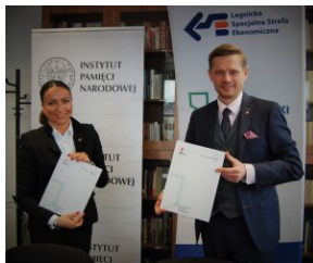
Oddział IPN we Wrocławiu w Dolnośląskim Kłastrze Edukacyjnym

Dolnośląski Klaster Edukacyjny działa od 2015 roku, a jego liderem jest Legnicka Specjalna Strefa Ekonomiczna. Klaster łączy potencjał gospodarczy i naukowy, tworząc fundament do współpracy dla szkół, inwestorów, samorządów oraz instytucji okołobiznesowych.