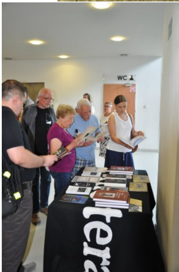
Spektakl „Ballada o Wołyniu”