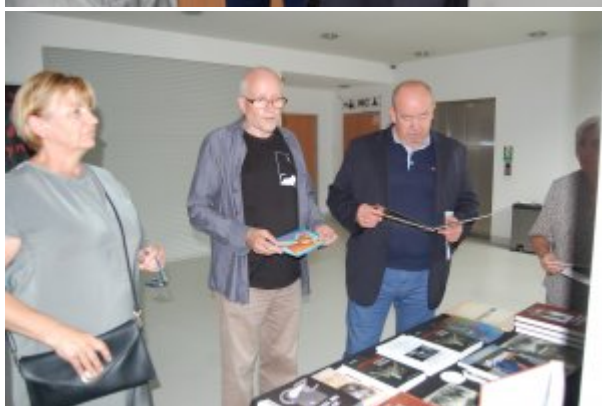
Spektakl „Ballada o Wołyniu”