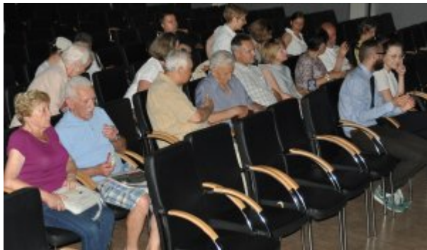
Spektakl „Ballada o Wołyniu”