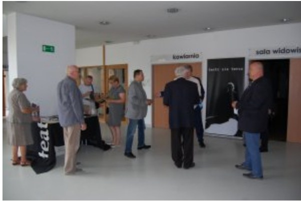
Spektakl „Ballada o Wołyniu”