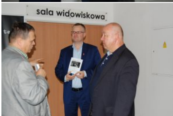
Spektakl „Ballada o Wołyniu”