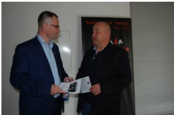
Spektakl „Ballada o Wołyniu”