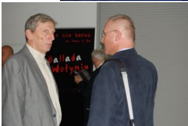
Spektakl „Ballada o Wołyniu”