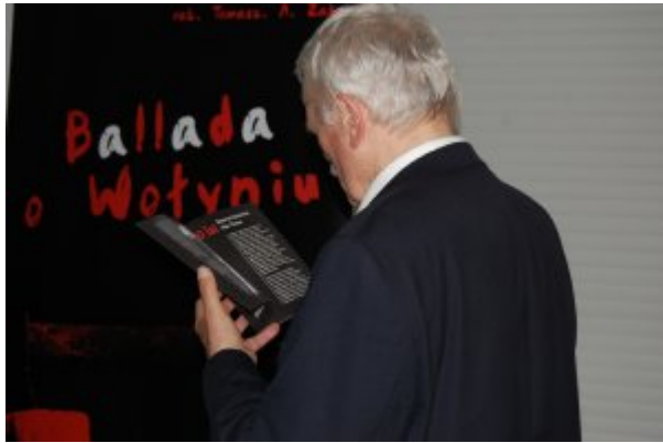
Spektakl „Ballada o Wołyniu”