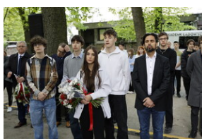
"Ziemia w miejscu masowych grobów"