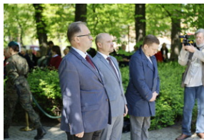
"Ziemia w miejscu masowych grobów zabarwka się na granatowo - od mundurów leżących w mogile policjantów" - Wrocław, 11 kwietnia 2024.