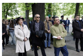
"Ziemia w miejscu masowych grobów"